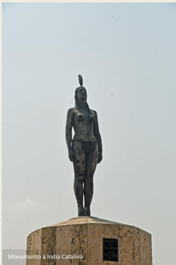
Monumento a India Catalina

De oorsprong van dit monument ligt bij het filmfestival, en niet omgekeerd