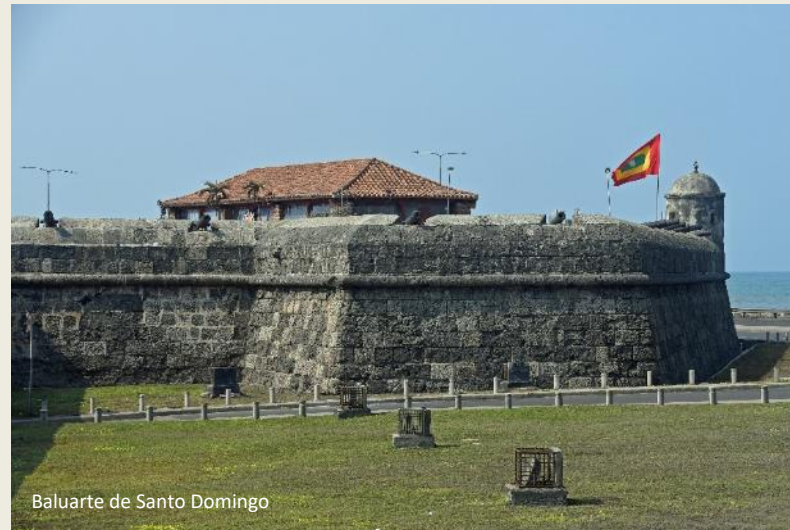
Baluarte de Santo Domingo