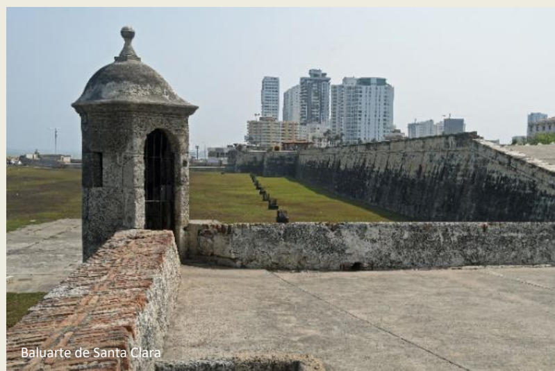
Baluarte de Santa Clara

Een zeer symbolische plek was het, waar in