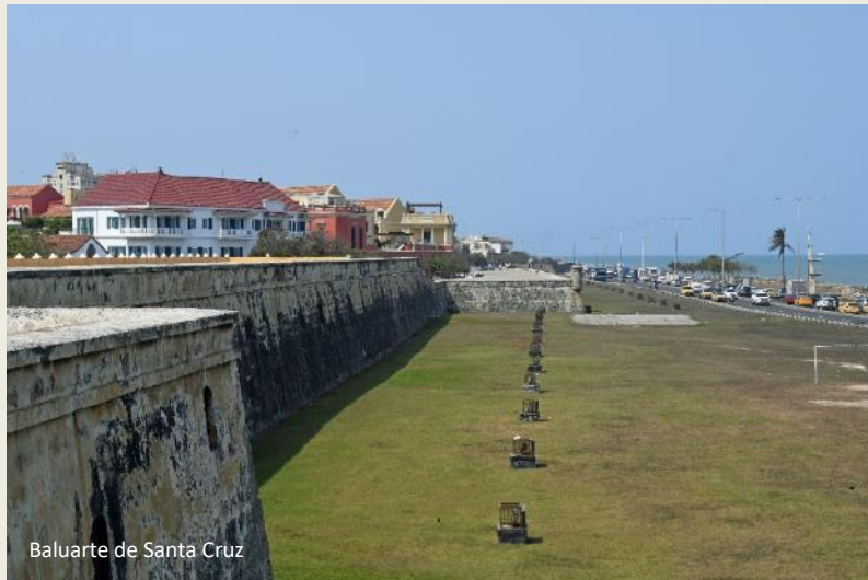
Baluarte de Santa Cruz

Piraten streken op de stad neer als vliegen op suiker