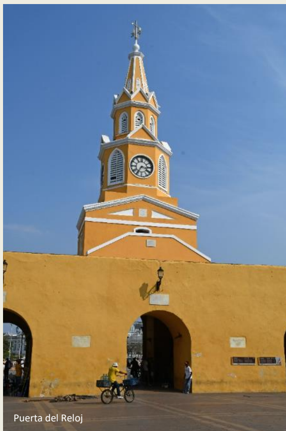
Puerta del Reloj