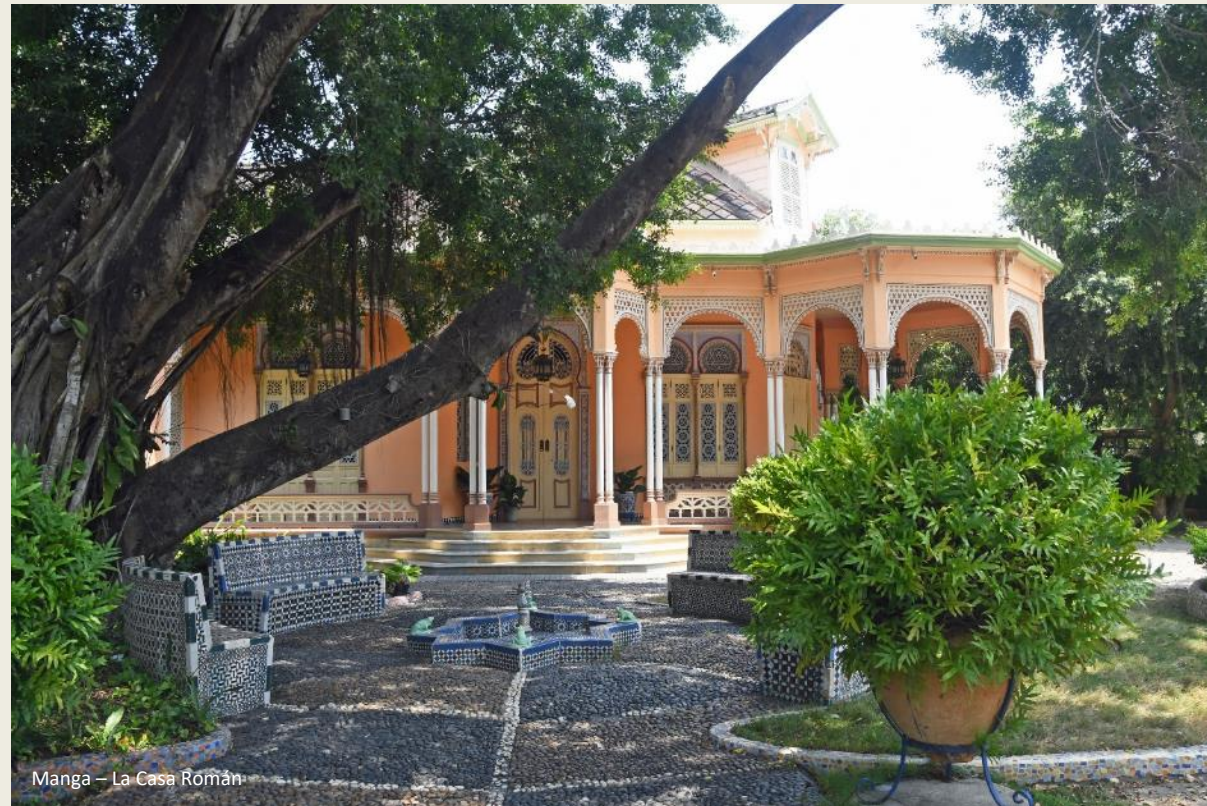
Manga – La Casa Román

Kennelijk wil Getsemaní een Ciudad Mural zijn in de betekenis die de Verenigde Naties eraan geven – lokale verhalen vertellen, een lokale identiteit tonen en via de creatie van