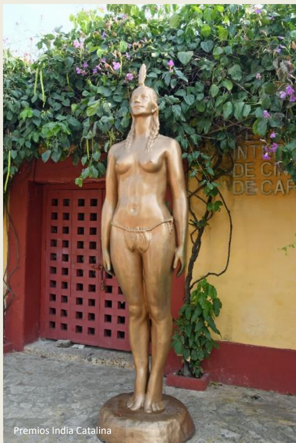
Premios India Catalina

boven het gebouw verheft. Oorspronkelijk was er zelfs een ophaalbrug voor de poort, zodat de stad van de buitenwereld afgesloten kon worden.