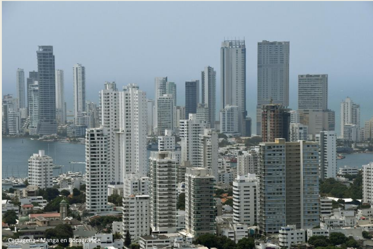
Cartagena – Manga en Bocagrande