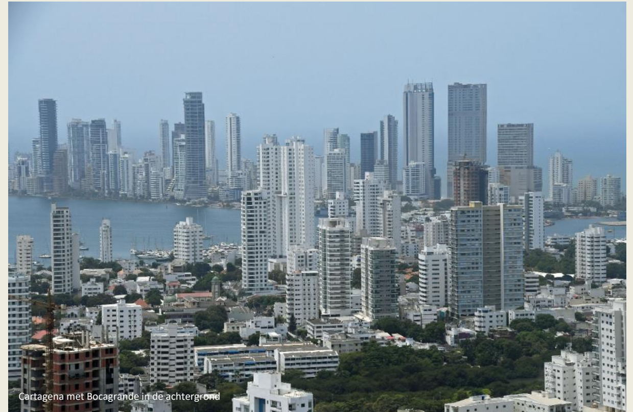
Cartagena met Bocagrande in de achtergrond