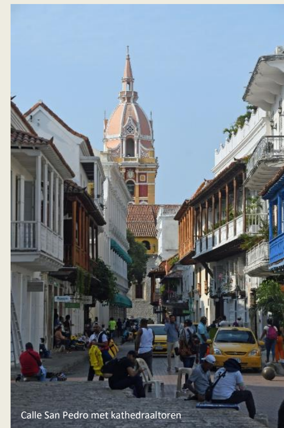
Calle San Pedro met kathedraaltoren

fort liep zelfs een ondergrondse galerij met kamers die konden worden opgeblazen om aanvallers op het juiste moment te kunnen verrassen.