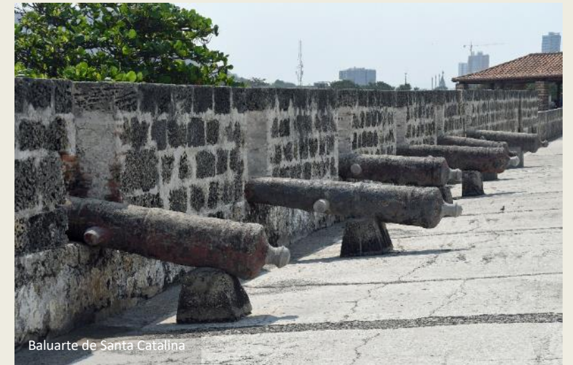
Baluarte de Santa Catalina