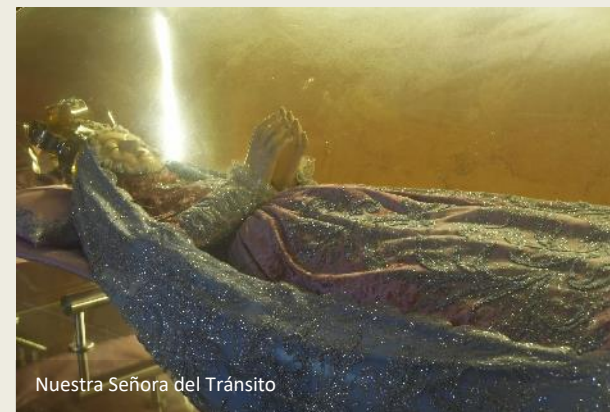
Nuestra Señora del Tránsito

De goudgele gevel die het plein domineert, maakt deel uit van de Iglesia de Santo Domingo . Een van de oudste kerken van Cartagena is dat, gebouwd vanaf 1552. Een gediplomeerd architect hoef je niet te zijn om meteen te merken dat er aan de vierkante toren iets schort – het bovenste deel ervan