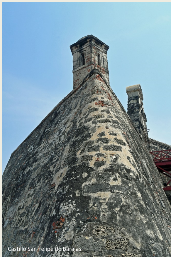
Castillo San Felipe de Barajas

ontbreken en zijn rechteroog met een ooglapje bedekt is. De man was van geen kleintje vervaard, ook niet in zijn privéleven, wist Isaac ons daarstraks nog te vertellen. Want de admiraal liet 35 kinderen na. Niet bij dezelfde vrouw, nemen we aan.