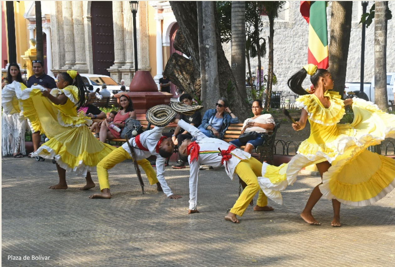
Plaza de Bolívar