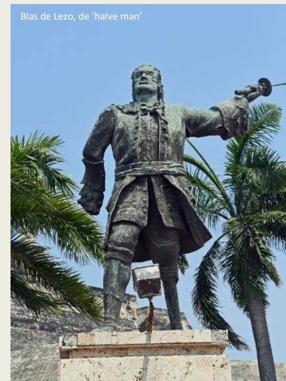
Blas de Lezo, de 'halve man'

'The Spanish pride pulled down by Admiral Vernon' lezen we op het medaillon, waar Blas de Lezo onderdanig voor Vernon knielt