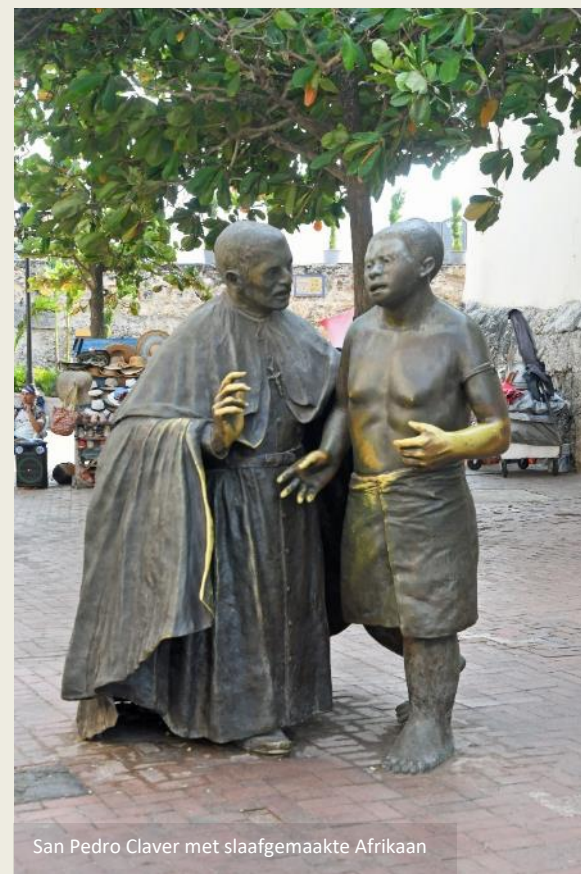
San Pedro Claver met slaafgemaakte Afrikaan

arriveerden. Op het aanpalende plein, de Plaza de los Coches , werd immers de slavenmarkt georganiseerd. Tegenwoordig is er op het plein niets dat nog aan die infame periode herinnert. Behalve dan de Ruta Herencia Afro , de zogenaamde route van het Afrikaanse erfgoed, een initiatief van de plaatselijke toeristische dienst. Het traject dat zij uitgestippeld hebben, leidt de geïnteresseerde bezoeker langs een aantal historische plekken die in het leven van de zwarte bevolking een grote rol gespeeld hebben.