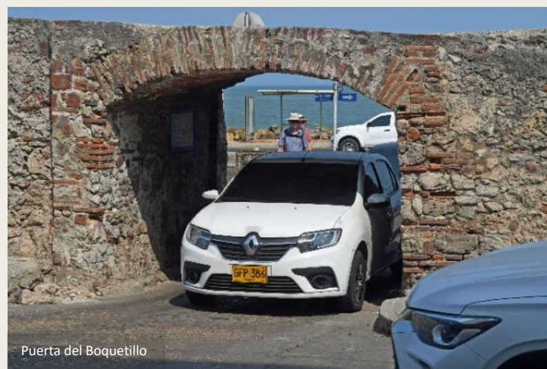
Puerta del Boquetillo