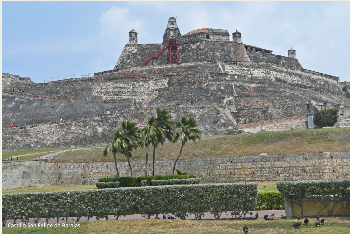
Castillo San Felipe de Barajas

Gezondheidsvoorzieningen worden zowel door de overheid als door private instanties georganiseerd. Het kwaliteitsverschil laat zich raden, het prijsverschil ook. In een publiek hospitaal wacht je soms twee dagen op hulp, in een privé-hospitaal word je onmiddellijk geholpen. Analooq voor het secundair onderwijs dat in privéscholen beter zou zijn dan in openbare scholen. Universitair onderwijs daarentegen is hier het best in de publieke universiteit. De toegang tot die unief is gratis, maar je moet wel slagen voor een ingangsexamen.