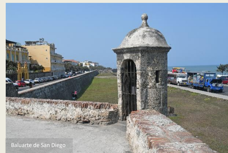
Baluarte de San Diego