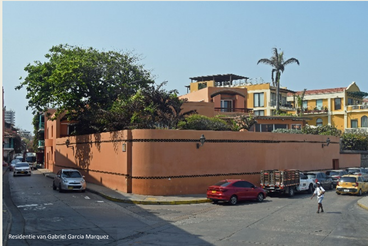
Residentie van Gabriel Garcia Marquez