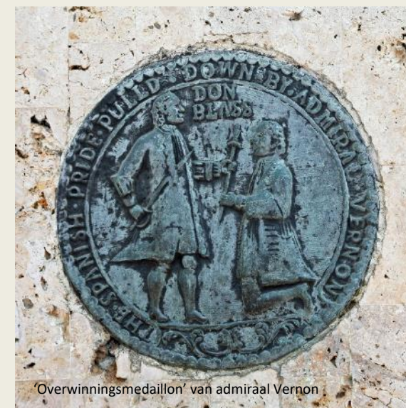
'Overwinningsmedaillon' van admiraal Vernon