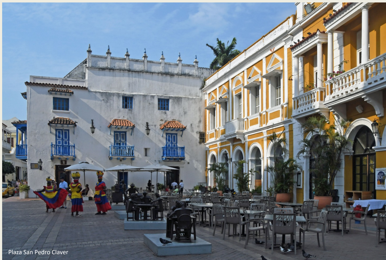
Plaza San Pedro Claver