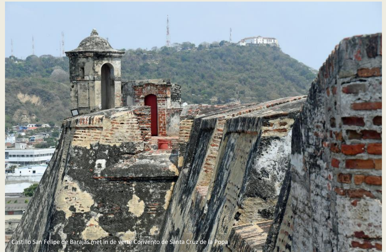
Castillo San Felipe de Barajas met in de verte Convento de Santa Cruz de la Popa

Tegenwoordig herinnert een standbeeld van Blas de Lezo aan die krachttoer. Kordaat hanteert hij een degen in zijn linkerhand, terwijl zijn rechterarm en zijn linkerbeen inderdaad