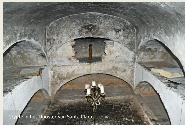
Crypte in het klooster van Santa Clara

Op de lommerrijke Plaza de Bolívar is altijd wel wat te doen. Vandaag zijn het enkele dansers die op het ritme van een orkestje met veel percussie een performance brengen. Muziek en dans zijn de Zuid-Amerikanen op het lijf geschreven. Dat blijkt ook hier.