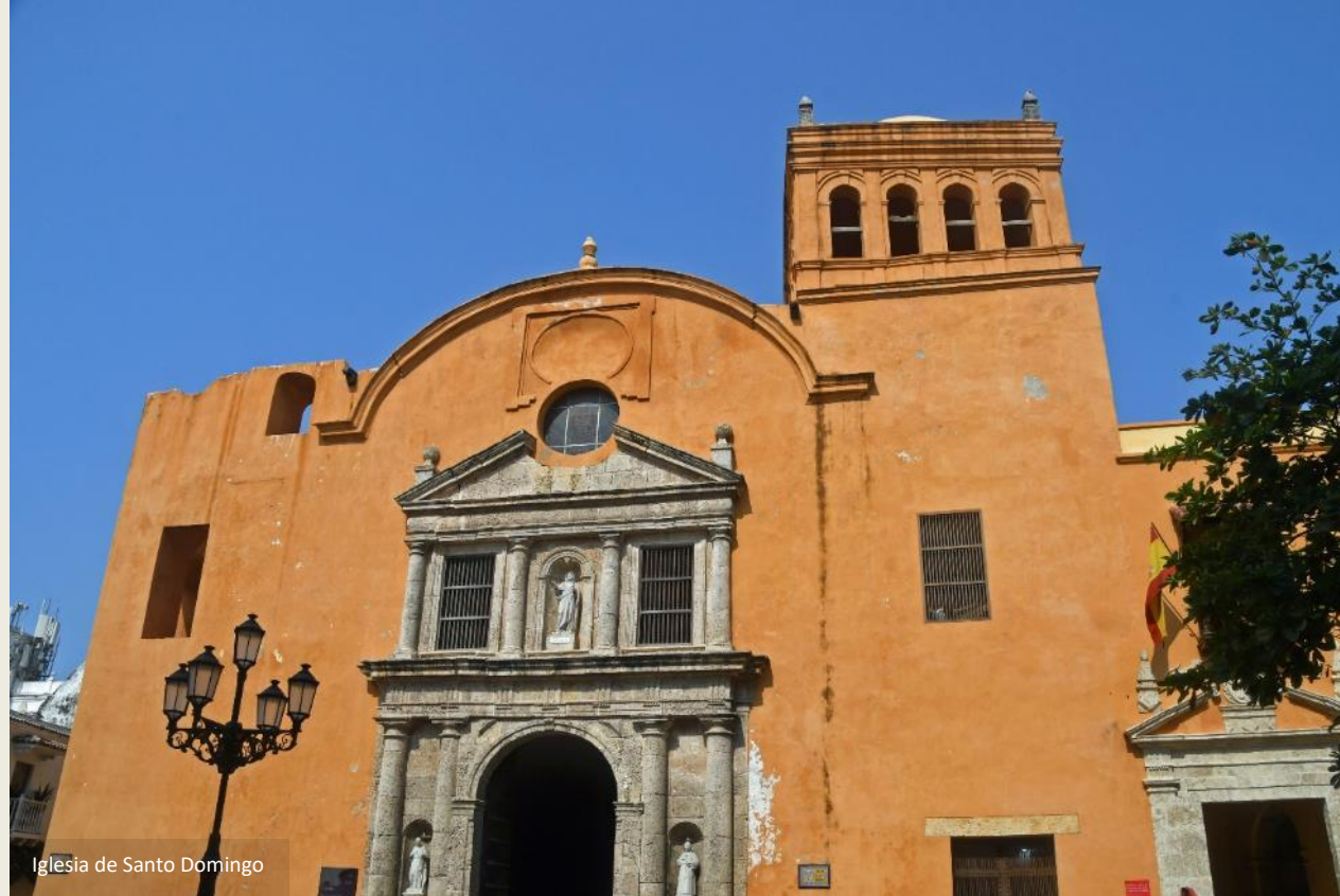
Iglesia de Santo Domingo

Een broeierig hete dag zal het worden, met temperaturen net boven dertig graden. Maar dat zal er ons niet van weerhouden om een laatste keer de oude stad te verkennen. Door de historische straatjes kuieren we naar de Plaza de Santo Domingo, een plein met een onfris verleden. Want hier was het dat de inquisitie haar slachtoffers executeerde, vooral joodse mensen, maar ook ketters en andere niet-katholieken.