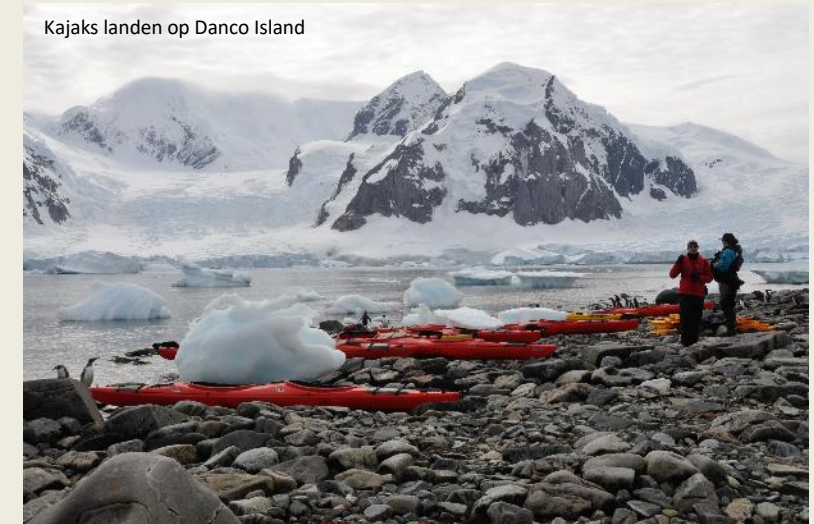
Kajaks landen op Danco Island

hun snuit, de zogenaamde meloen, fungeert als een akoestische lens. Zo ontstaat een gerichte bundel van kliksignalen. Al wat de orka nog moet doen, is even de kop draaien om de bundel in de gewenste richting te sturen.