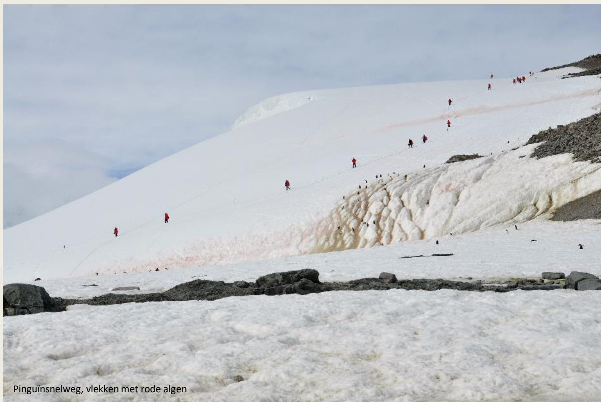
Pinguïnsnelweg, vlekken met rode algen

Nu vallen ons bruinrode vlekken op de maagdelijke witte sneeuw op. Neen, milieuverontreiniging is dat niet, zullen we straks van Vadim vernemen, onze Russische wiskundige met een passie voor de polen. Dat zijn rode