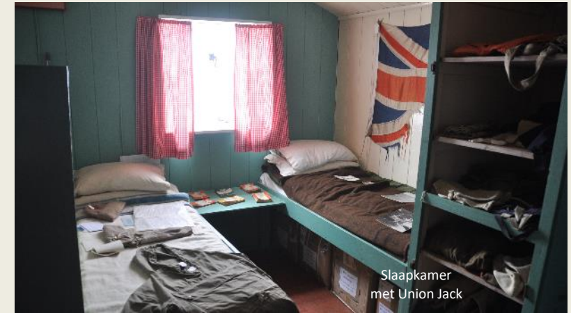
Slaapkamer met Union Jack

het Tabarinteam langs ditzelfde traject jaarlijks onder meer een vijftigtal vaten stookolie naar boven zeulde voor hun levensnoodzakelijke dieselgenerator.