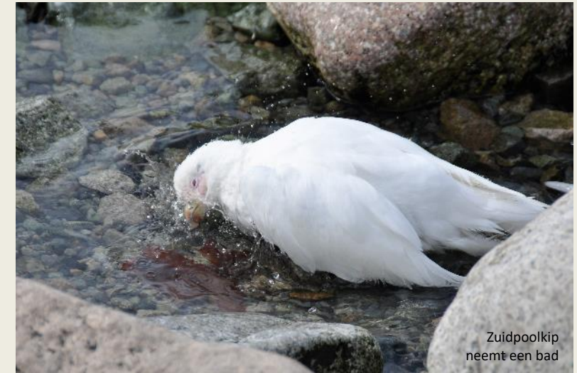
Zuidpoolkip neemt een bad

naam komt voort uit het feit dat ze de inhoud uit de cellen van hun prooi zuigen zoals een beer honing uit een raat zuigt. Echte overlevers zijn het, die beerdiertjes. Extreme temperaturen, volledige uitdroging, ze hebben er geen moeite mee.