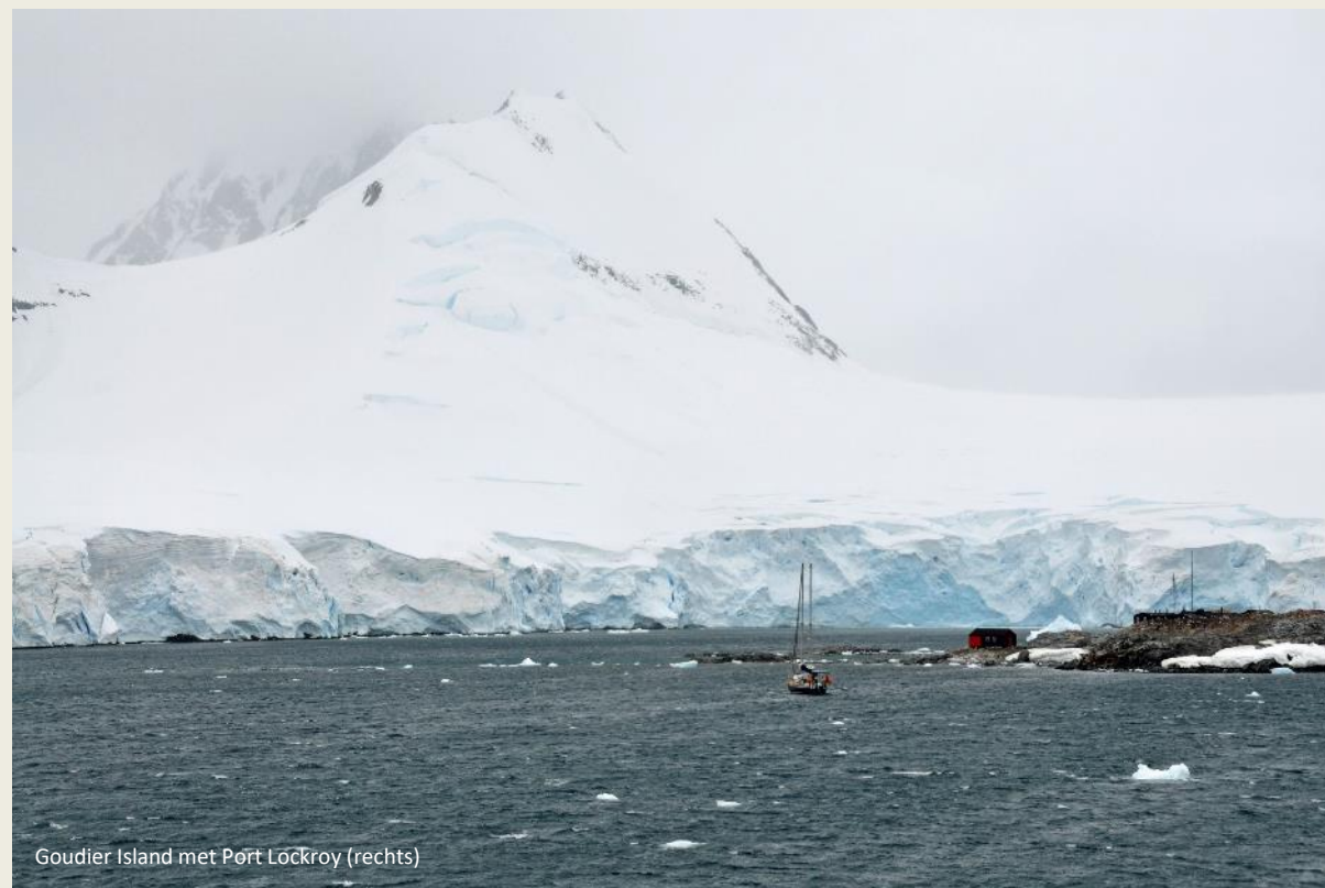
Goudier Island met Port Lockroy (rechts)

Tegenwoordig wordt Bransfield House iedere zomer vier maanden lang door een