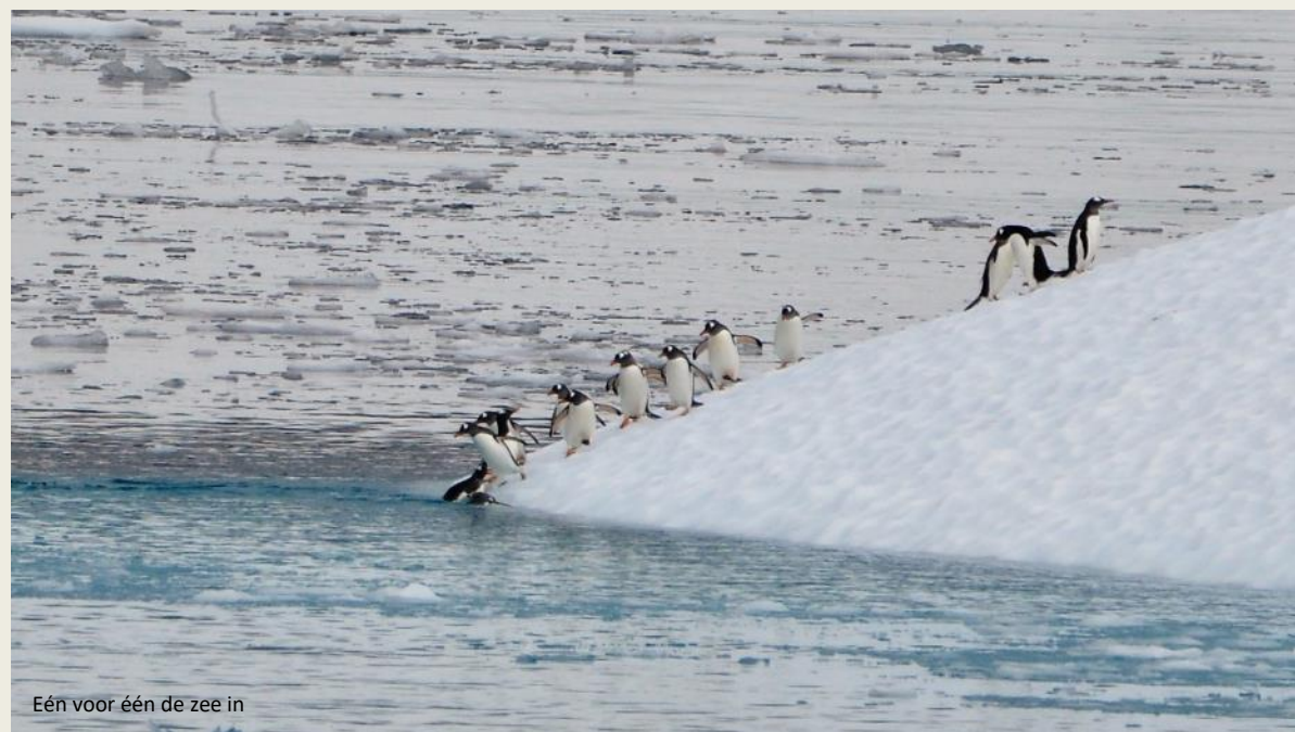
Eén voor één de zee in