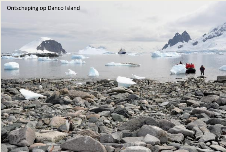
Ontscheping op Danco Island