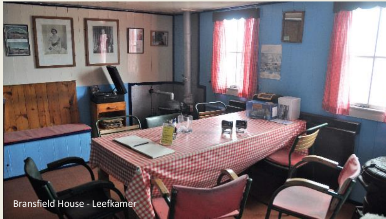
Bransfield House - Leefkamer