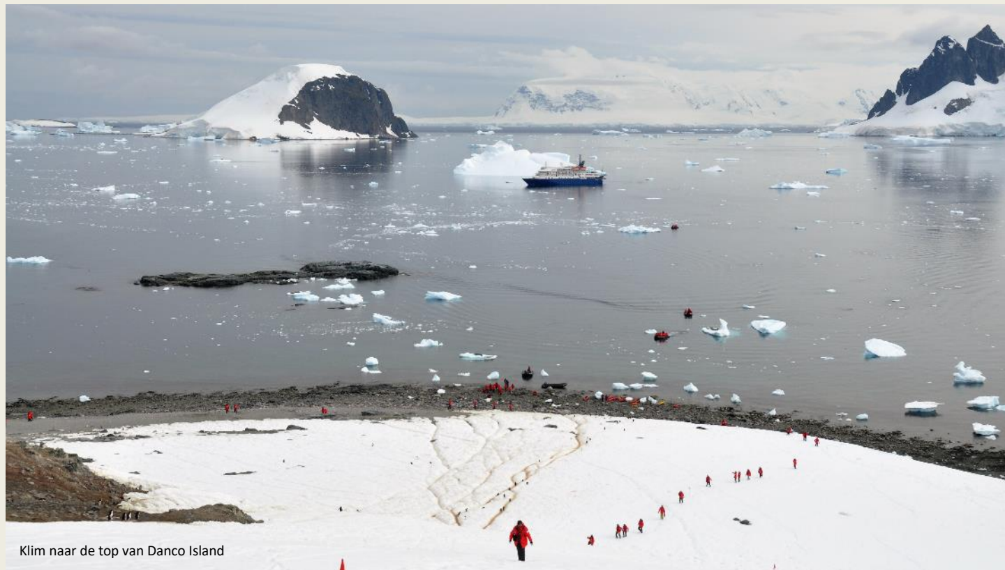
Klim naar de top van Danco Island

Met al die drukte zou je het bijna vergeten. Danco Island is onze bestemming. Terwijl we ons ontbijt verder afwerken – in het restaurant zijn Miguel en co nog steeds dienstwillig op post – bergt kapitein Oleg