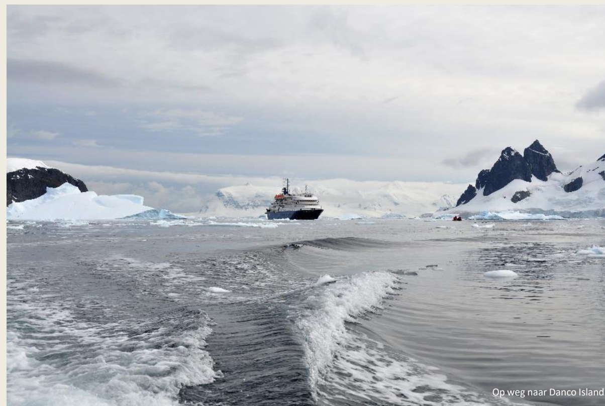
Op weg naar Danco Island

Dat lijkt sterk op de ultrasone tonen die vleermuizen hanteren, maar orka's doen het met hoogfrequente kliksignalen. Die genereren ze vermoedelijk met luchtverplaatsingen in hun neusgaten. Een bolvormig orgaan op