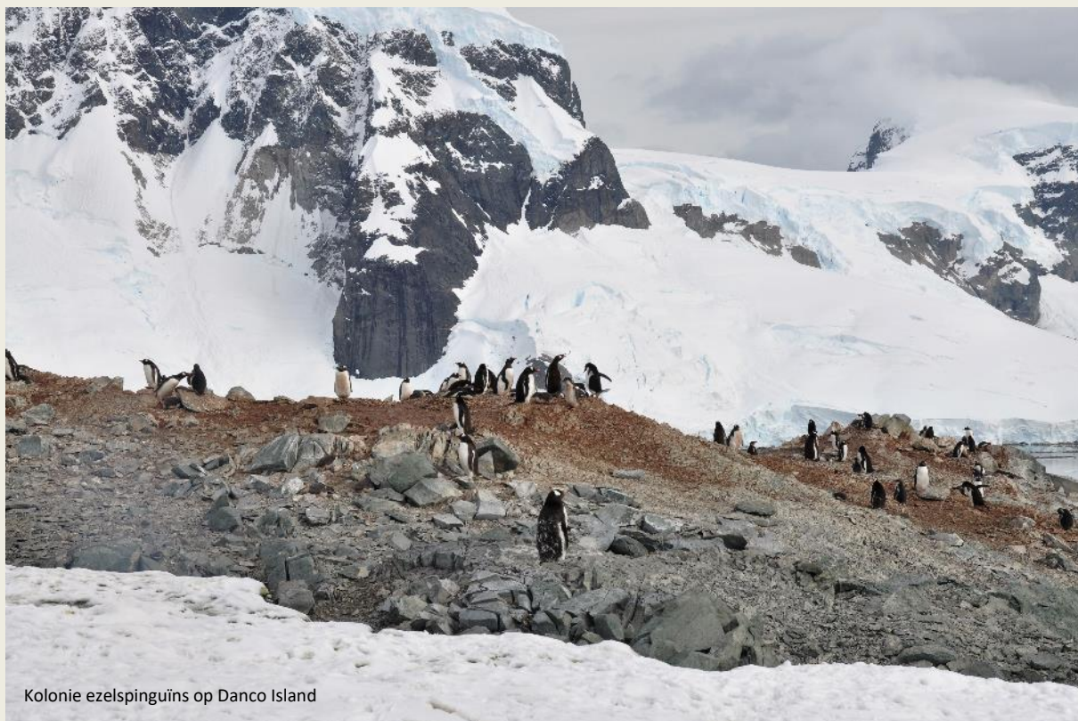
Kolonie ezelspinguïns op Danco Island

zeer gemakkelijk te herkennen. Die witte vlekken zouden aan een Indiase hoofddoek doen denken. Vandaar de Engelse naam gentoo voor deze pinguïns, een denigrerende naam voor hindoes met een hoofddoek.