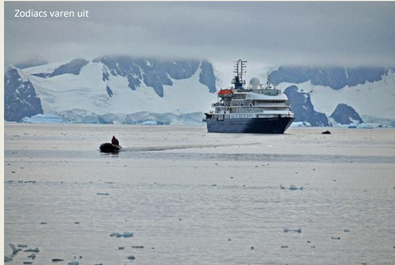
Zodiacs varen uit