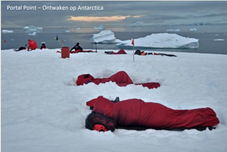
Portal Point – Ontwaken op Antarctica