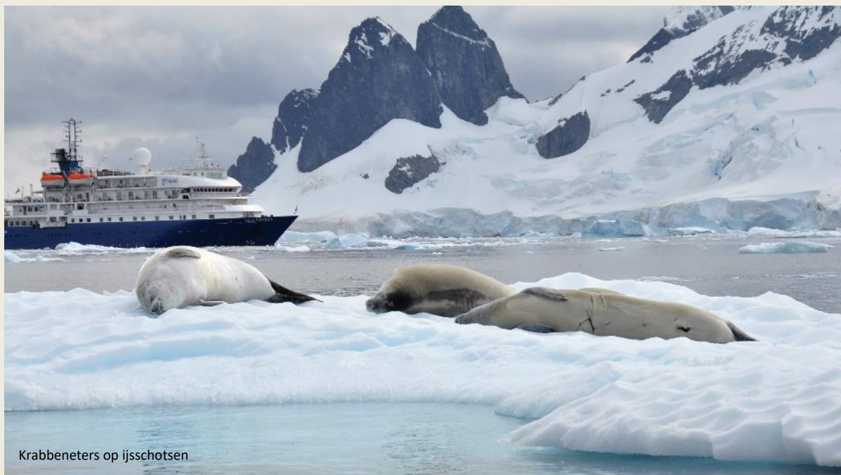
Krabbeneters op ijsschotsen