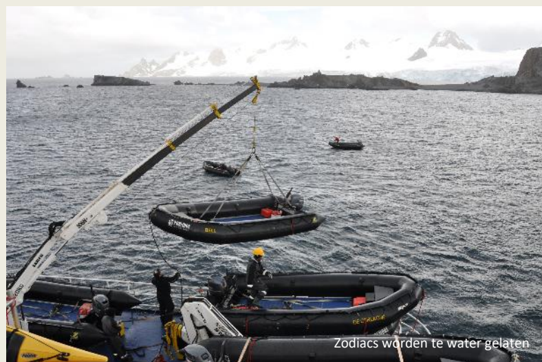
Zodiacs worden te water gelaten

In de verte zoeven al enkele zodiacs vol rode mannetjes in de richting van de kust. De lucht