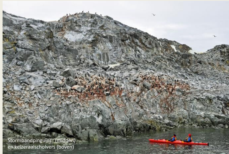
Stormbandpinguïns (midden) en keizeraalscholvers (boven)

jong mannetje dus. Toch moet hij het al met andere mannetjes aan de stok gehad hebben, waarschijnlijk over een wijfje. Daar getuigen de vele schrammen op zijn bovenlijf van. Een volgroeid mannetje kan tot drie ton wegen. Zeeolifanten behoren dan ook tot de grootste levende zeeroofdieren.