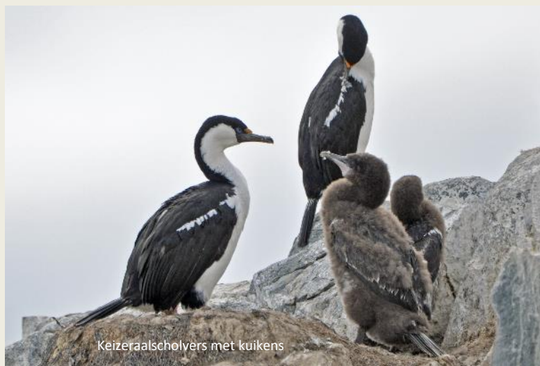
Keizeraalscholvers met kuikens