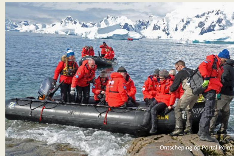
Ontscheping op Portal Point