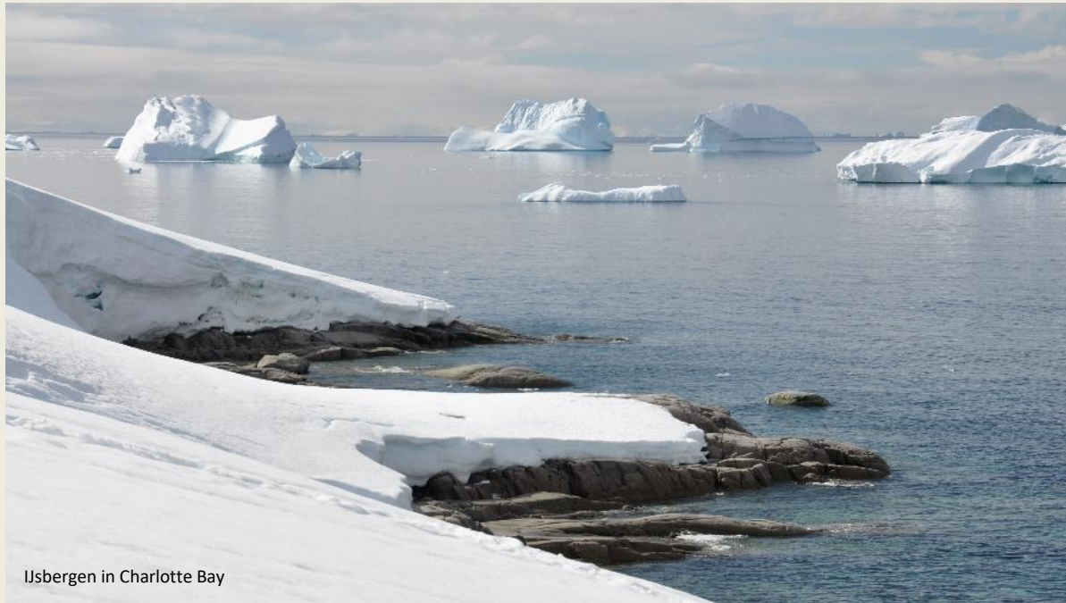
Ijsbergen in Charlotte Bay