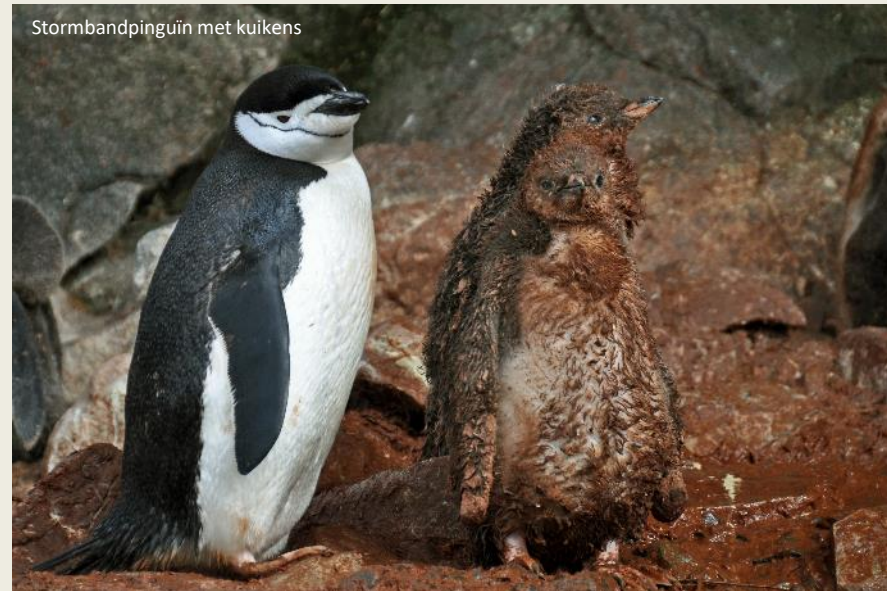
Stormbandpinguïjn met kuikens

Zo mogelijk nog gevaarlijker voor de pinguïns is de subantarctische grote jager die zich voorlopig gedeisd houdt aan de rand van de