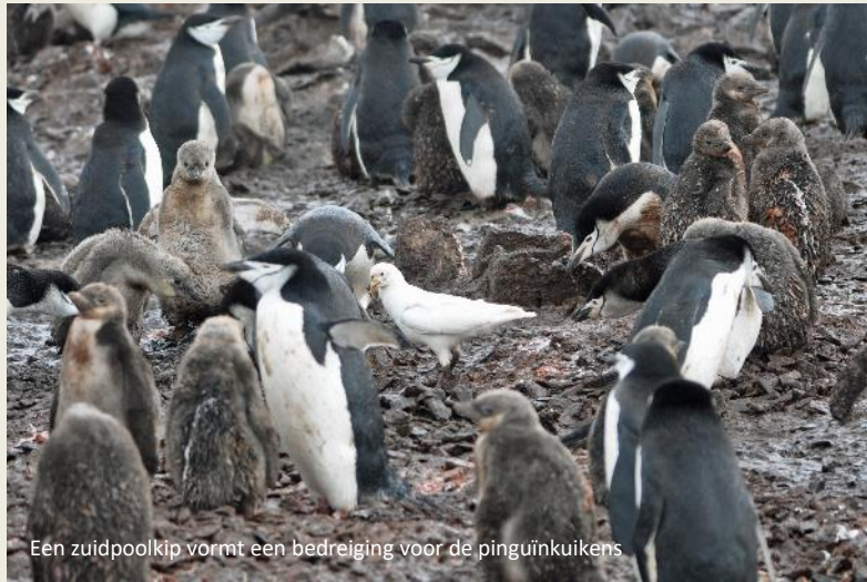
Een zuidpoolkip vormt een bedreiging voor de pinguïnkukens

De zuidpoolkip laat zich niet zo gauw intimideren. Dat ze niet welkom is, daar kan ze mee leven