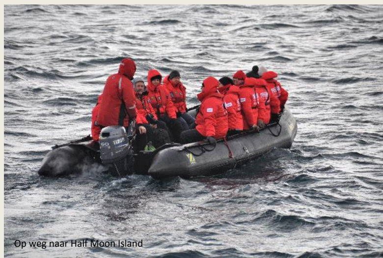
Op weg naar Half Moon Island