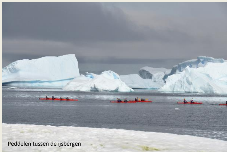
Peddelen tussen de ijsbergen