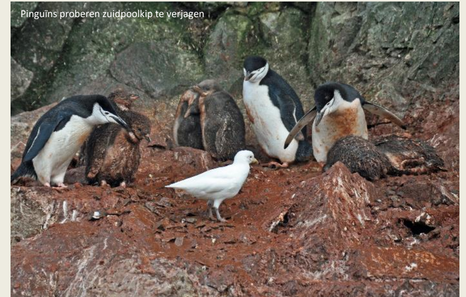
Pinguïns proberen zuidpoolkip te verjagen