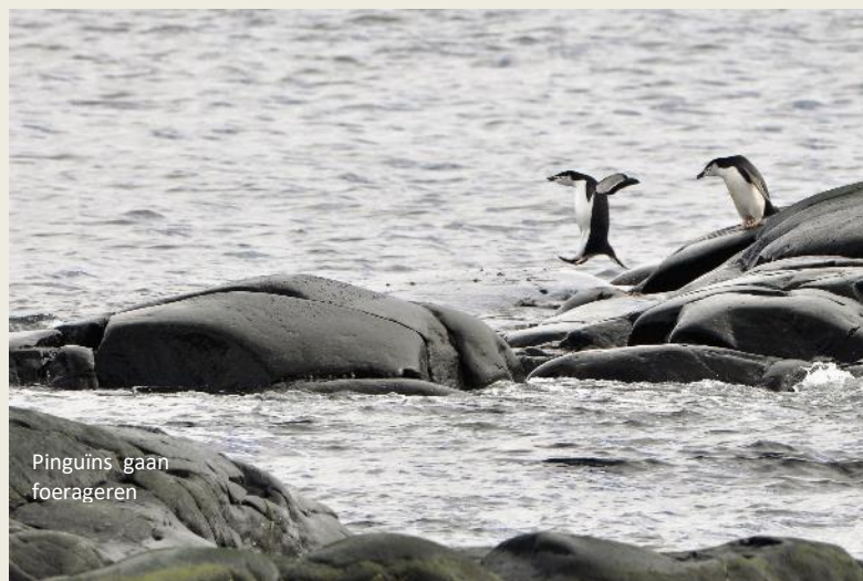
Pinguïns gaan foerageren