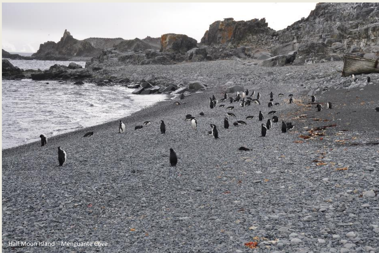
Half Moon Island – Menguante Cove

Vlot klimmen we aan boord en installeren ons op de volumineuze, zwarte romp. Die is