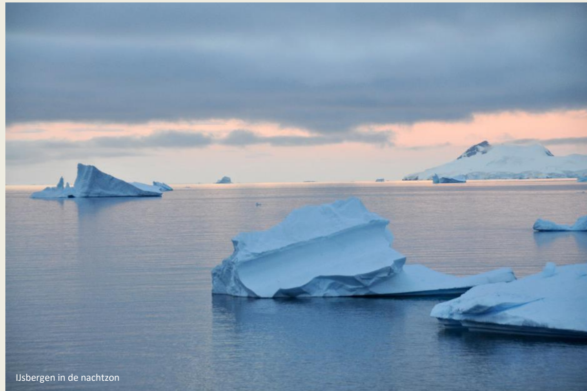
Ijsbergen in de nachtzon

Maar dan, vierduizend meter hoog, kwam er geleidelijk de vaart in, met dagetappes van 50, 100, 200 en zelfs 500 km. Uiteindelijk wisten ze na 99 dagen de vierduizend kilometer