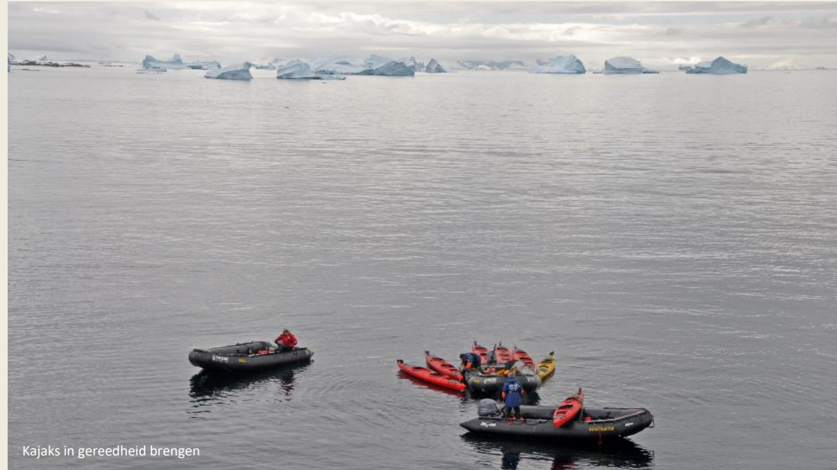
Kajaks in gereedheid brengen