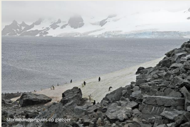
Stormbandpinguïns op gletsjer