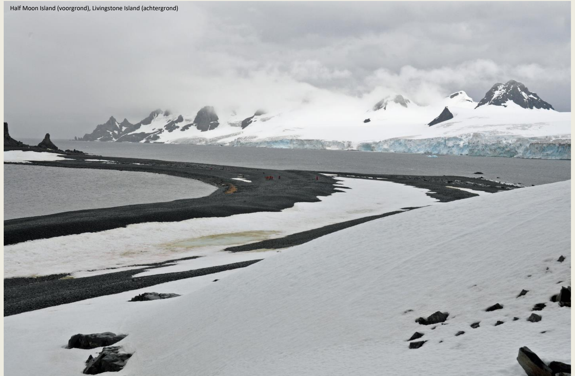
Half Moon Island (voorground), Livingstone Island (achtergrond)

tijd ligt het eerste ei daar, soms wordt het zelfs uit het nest geschopt. Slaagt het eerste kuiken er toch in tot leven te komen, dan zal