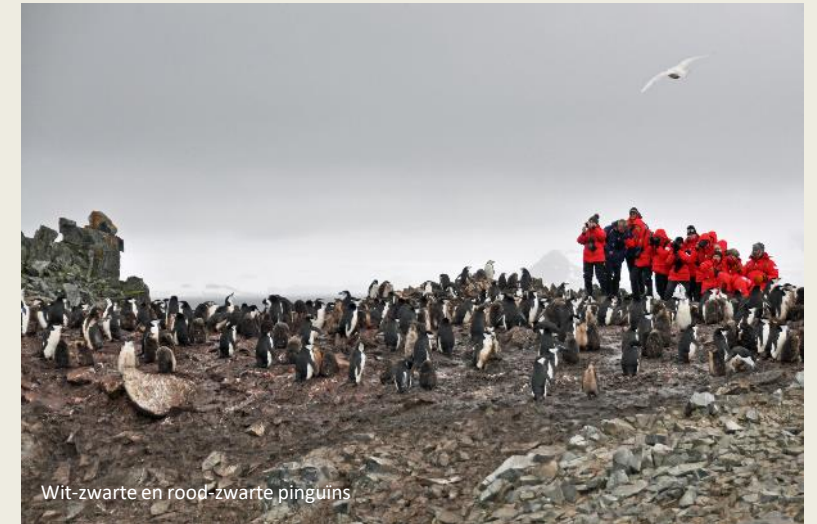
Wit-zwarte en rood-zwarte pinguïns