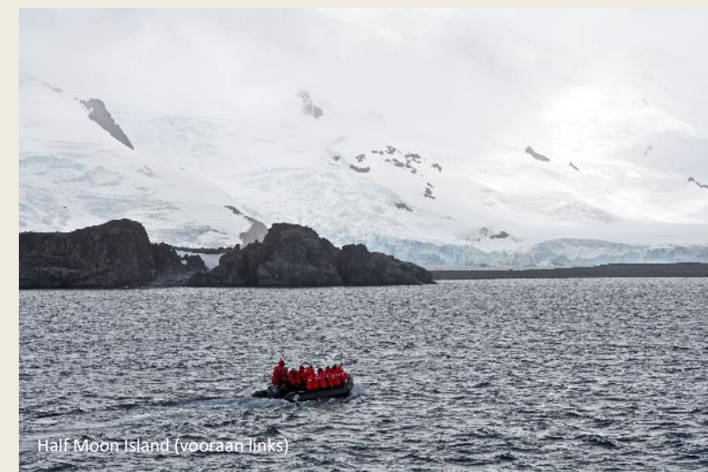
Half Moon Island (vooraan links)