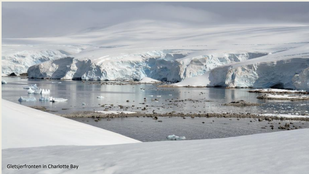
Gletsjerfronten in Charlotte Bay

Een historisch moment zit er nu aan te komen – onze eerste voetstappen op continentaal Antarctica