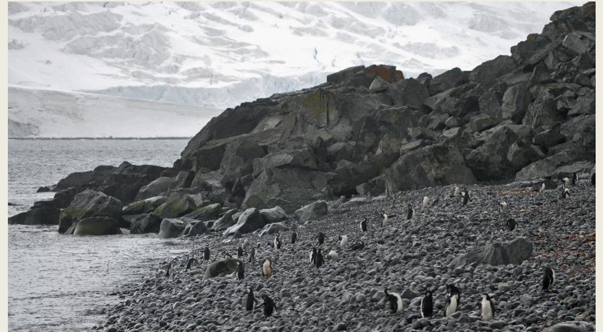
Op weg naar Baliza Hill

Maagdelijk witte sneeuw onttrekt de crevasse s, de gletsjerspleten, grotendeels aan het zicht. Beneden aan de gletsjerwand, waar al eens een ijsberg voorbijdrijft, rijzen de seracs , de blauwgrijze ijstorens, monumentaal