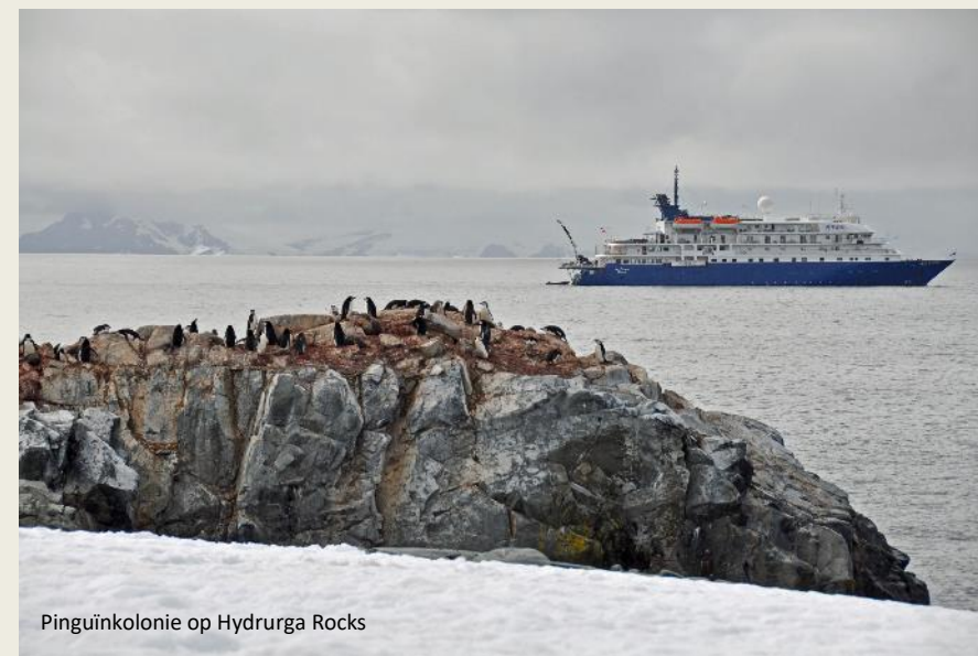
Pinguïnkolonie op Hydrurga Rocks

voor belagers van boven en van beneden moeilijker zichtbaar – de pinguïns terwijl ze zwemmen, de aalscholvers terwijl ze vliegen. Zelfs hun kuikens verschillen van op enige afstand niet zoveel van elkaar, met hun naïef