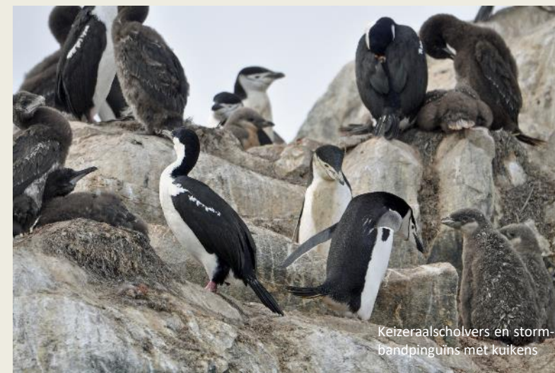
Keizeraalscholvers en stormbandpinguïns met kuikens