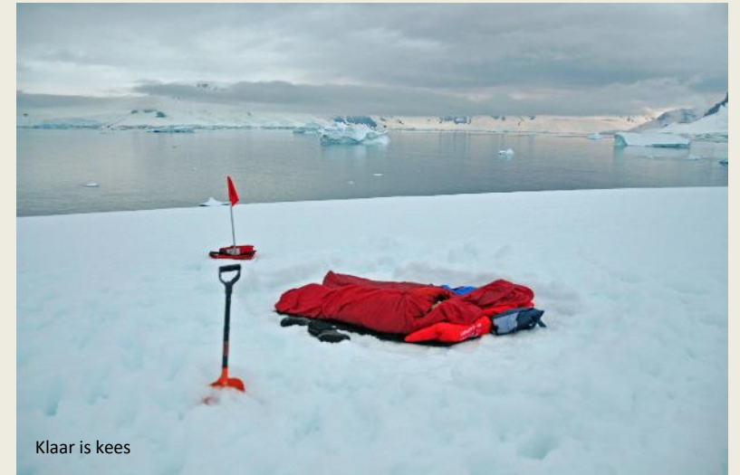
Klaar is kees

1997-1998, het seizoen waarin ze op eigen kracht de oversteek van dit immense continent zouden wagen – vierduizend kilometer over meedogenloos terrein. Torenhoge desillusies werden hun deel. Nog maar net twee dagen na hun vertrek brak Dixie twee ribben. Alain deed in het tentje een koolmonoxidevergiftiging op waarvan ze aanvankelijk dachten dat het slechts hoogteziekte was. Dertig dagen na hun vertrek hadden ze amper 280 km afgelegd, terwijl één derde van hun proviand al verbruikt was.