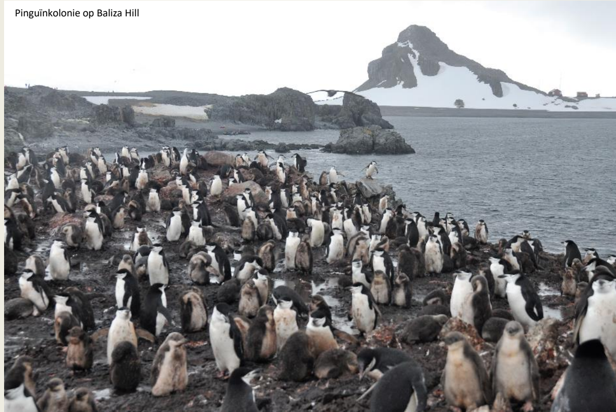
Pinguïnkolonie op Baliza Hill

of meer in straten georganiseerd – al bespeu-ren wij daar in deze chaos niets van. Toch vin-den de koppeltjes elkaar bij het begin van het seizoen in dit stratenplan terug. Mocht het wijfje onverhoopt niet opdagen, dan zal mijn-heer zich niet schromen om met mevrouw van hiernaast aan te pappen.