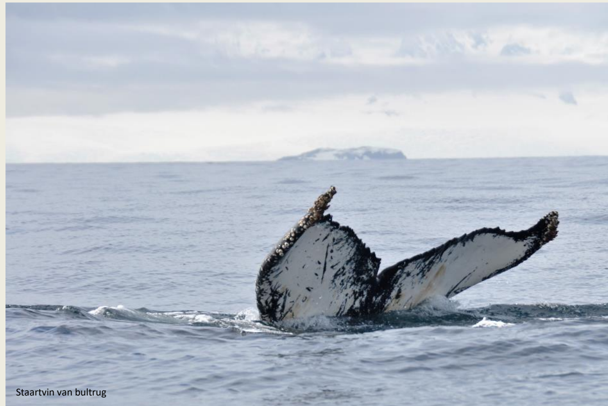
Staartvin van bultrug

De zon heeft de overhand nu, de meeste wolken zijn naar de horizon verdreven, de lucht