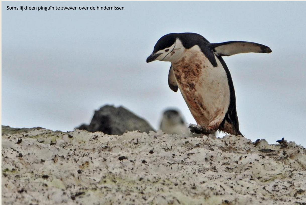
Soms lijkt een pinguïn te zweven over de hindernissen

tijdens de lange, donkere poolnacht moet hij het van zijn snorharen hebben om bewegingen van potentiële prooien te detecteren.