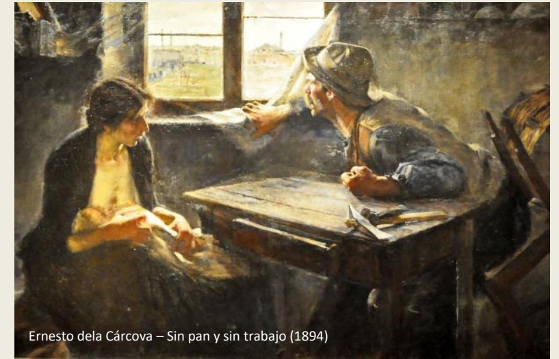
Ernesto de la Cárcova – Sin pan y sin trabajo (1894)

Tegelijkertijd ontwikkelde zich ook een eigen Argentijnse kunst, die in diezelfde 19e eeuw sterk sociaal gericht was. Opvallend zijn de striemende voorstellingen van honger en werkloosheid waarvan de kritische ondertoon niet mis te verstaan is.