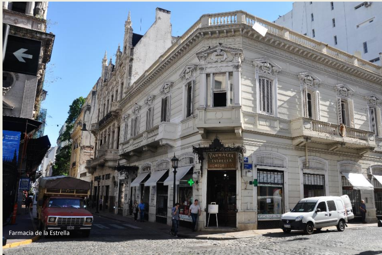
Farmacia de la Estrella

Een propagandastuk was dat, bedoeld om de genocide op de indianen te vergoelijken