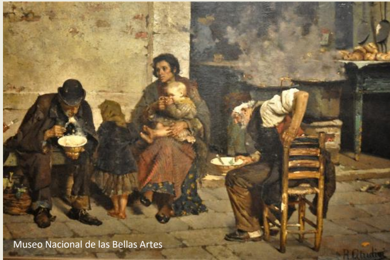
Museo Nacional de las Bellas Artes