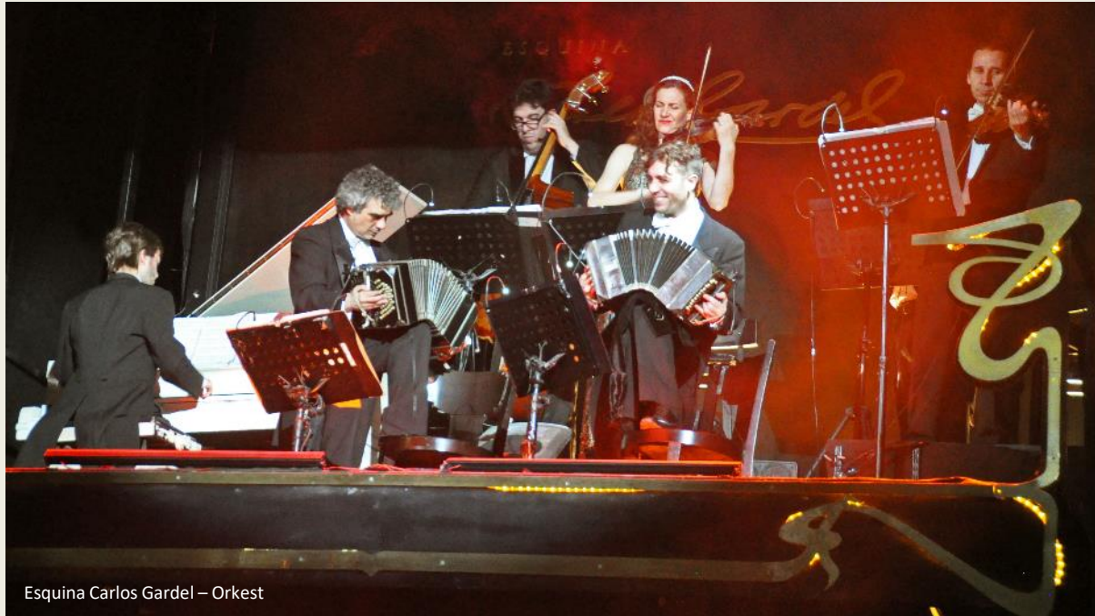
Esquina Carlos Gardel – Orkest

En dat lukt moeiteloos. Een wervelende, intelligente evocatie van de historische evolutie van de tango wordt het. Te beginnen bij de eenvoudige danspassen van eenzame armoezaaiers van verschillende nationaliteiten die elkaars gezelschap opzochten. Om uit te groeien tot de sociale mix van Club Social Almagro, een ware broedplaats van tangodansen.