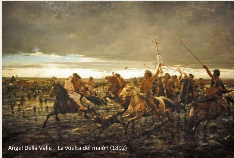
Angel Della Valle – La vuelta del malón (1892)