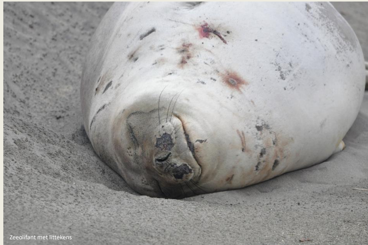
Zeeolifant met littekens

Ondertussen is de Salina Grande aan het raam verschenen. Hier was het dat ruim een eeuw geleden de zoutwinning de regio een eerste boost gaf. Het zoutmeer ligt 42 m onder de zeespiegel. Samen met de wat kleinere Salina Chica vormt het de enige oneffenheid in dit eindeloze vlakke landschap.