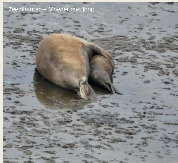
Zeeolifanten – Moeder met jong

Eens de strijd gewonnen, gaat het mannetje een harem rond zich verzamelen. Sommige alfamannetjes slagen er in tot 50 wijfjes in één seizoen te bevruchten. De keerzijde van die medaille is dat hij al die tijd op het strand