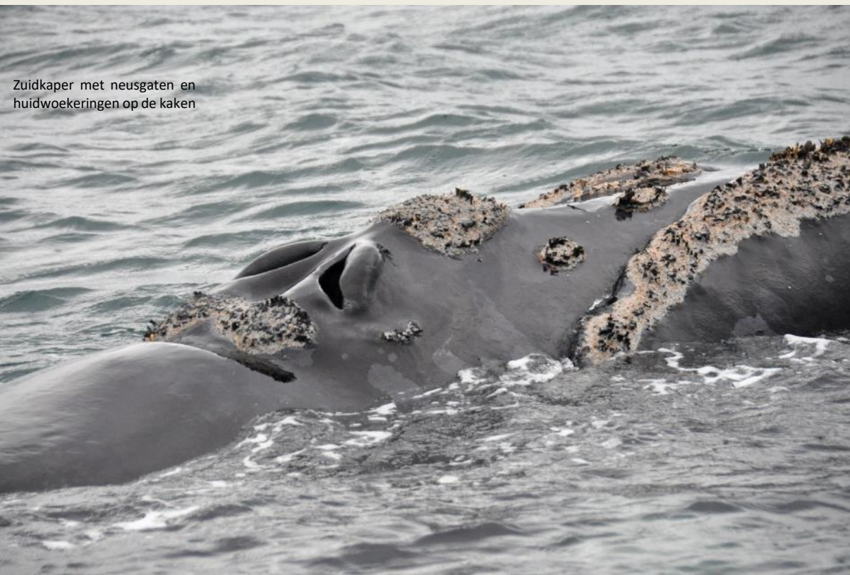
Zuidkaper met neusgaten en huidwoekeringen op de kaken

Als de baby dan geboren wordt, is hij meteen vijf meter lang. En elke dag komt daar twee