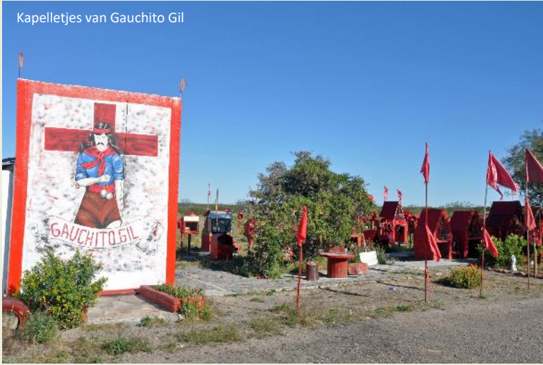
Kapelletjes van Gauchito Gil