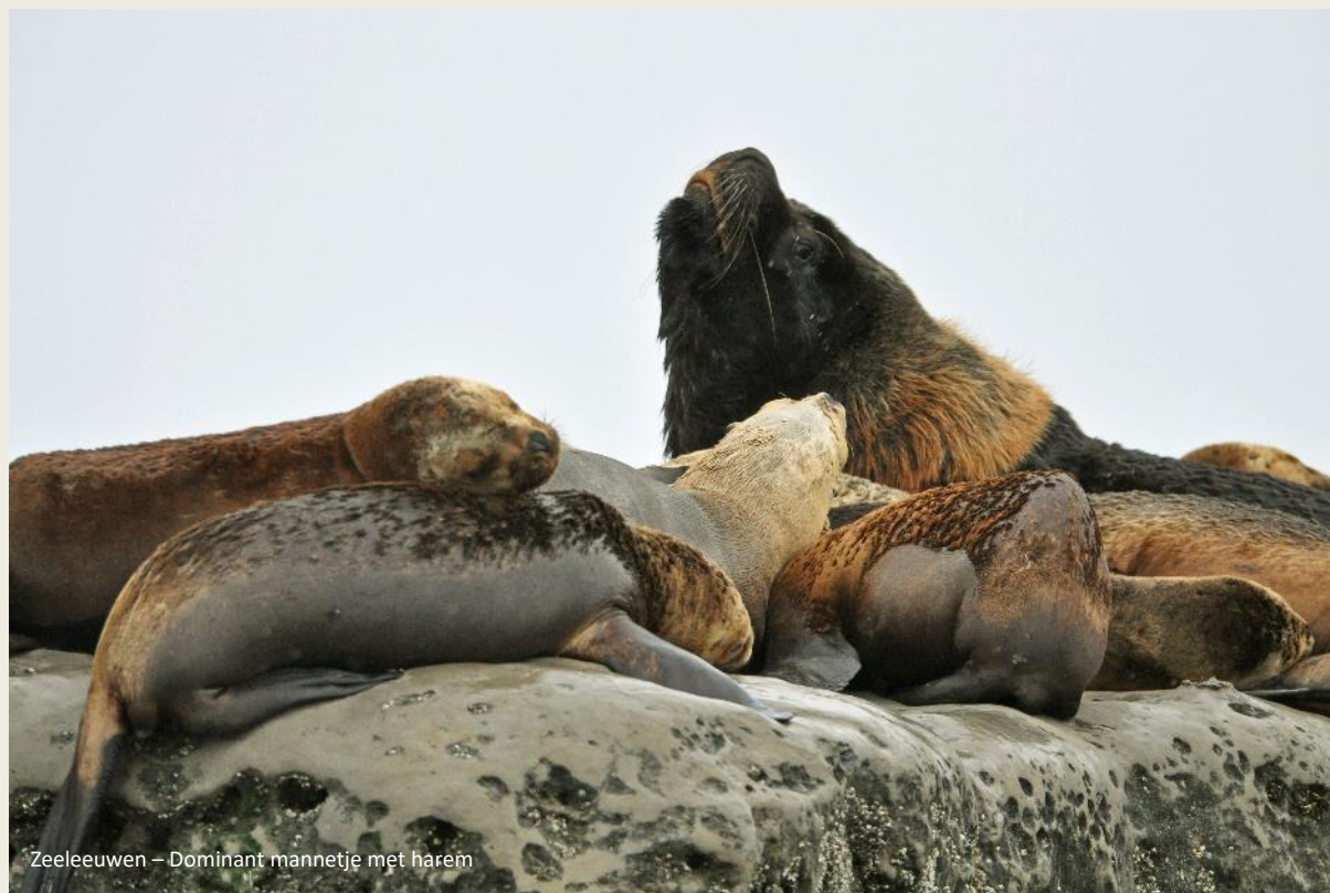
Zeeleeuwen – Dominant mannetje met harem

Gaandeweg begint het te regenen, daar zijn wij dan weer gevoelig voor. Geen motregen ditmaal, maar dikke regendruppels van het koude, natte type.