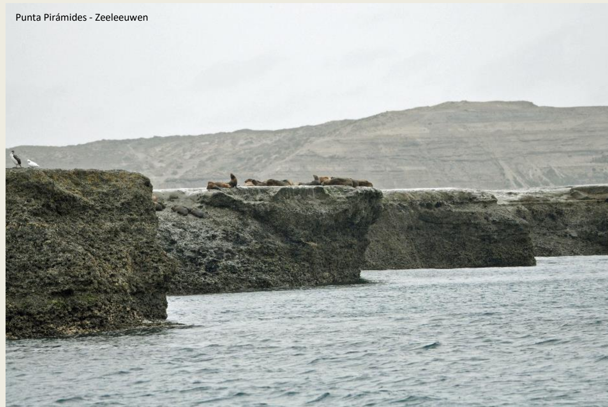
Punta Pirámides - Zeeleeuwen

Dat is al lang verleden tijd, tegenwoordig staat het dorpje van iets meer dan 400 inwoners volledig in het teken van de jacht op walvissen – met fototoestellen, wel te verstaan. Dat gebeurt op open boten, blootgesteld aan zon, regen en wind. Maar de zon is vandaag niet van de partij. Dus laten we ons met cape en zwemvest induffelen.