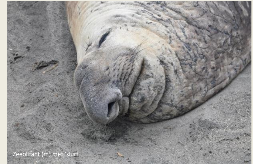
Zeeolifant (m) met 'slurf'

moet blijven om over zijn wijfjes te waken – zonder voedsel, terend op zijn vet. Want er zijn voortdurend kapers op de kust.