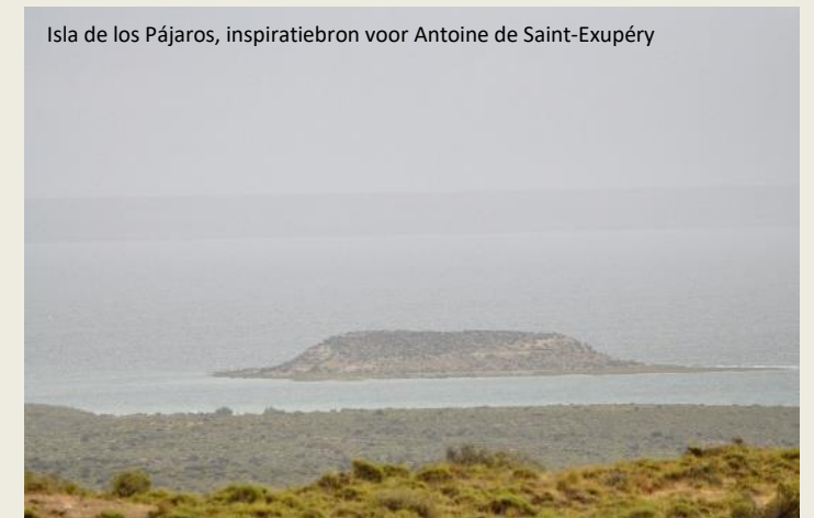
Isla de los Pájaros, inspiratiebron voor Antoine de Saint-Exupéry

Met hun kleine longen kunnen baby's hooguit twintig minuten onder water blijven. Wil je migreren, dan volstaat dat niet, want dan moet je lange tijd onder water kunnen zwemmen om snelheid te halen. Dus zit er voor een walvismoeder niets anders op dan te wachten tot haar baby voldoende sterk is, vier maanden lang. Al die tijd heeft ze bijna niets te eten. Is de baby voldoende aangesterkt, dan begint de lange tocht naar de koude wateren van Antarctica, hier zo'n drie-