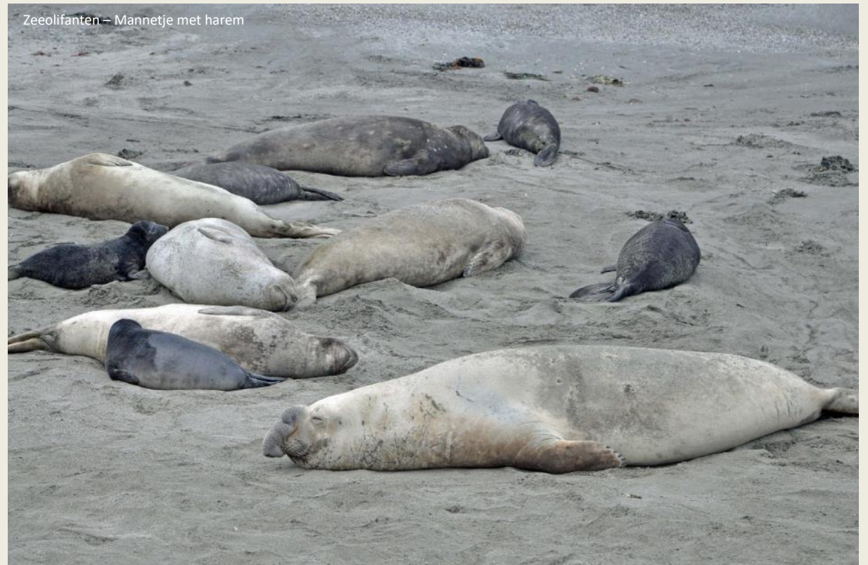
Zeeolifanten – Mannetje met harem