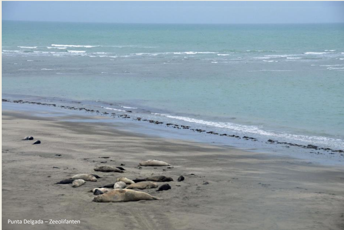
Punta Delgada – Zeeolifanten

het water terugkeren, een indringer verjagen, achter een wijfje aan zitten. Maar grote verplaatsingen moet je van hen niet verwachten.