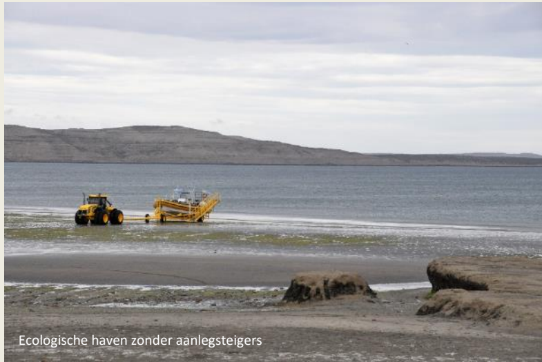
Ecologische haven zonder aanlegsteigers