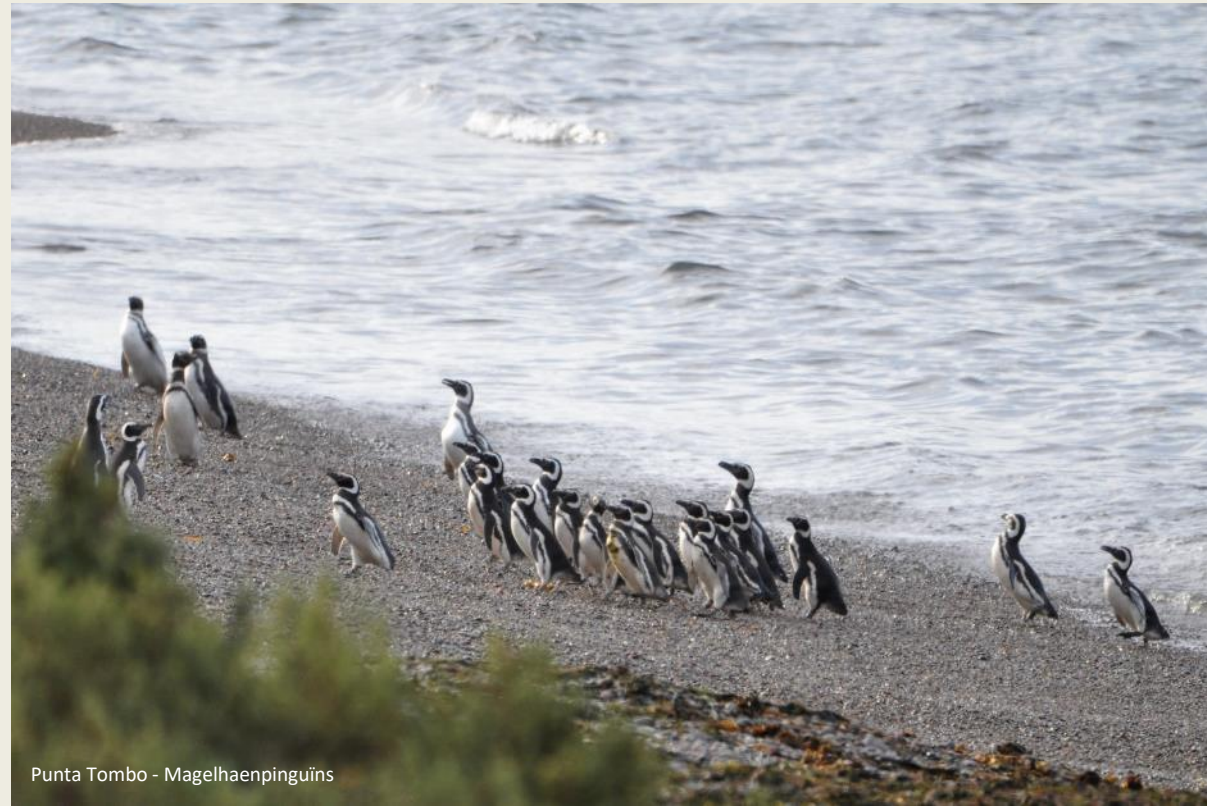
Punta Tombo - Magelhaenpinguïns

Op het ijs zal je magelhaenpinguïns nooit aantreffen, wel in een halfwoestijn zoals op