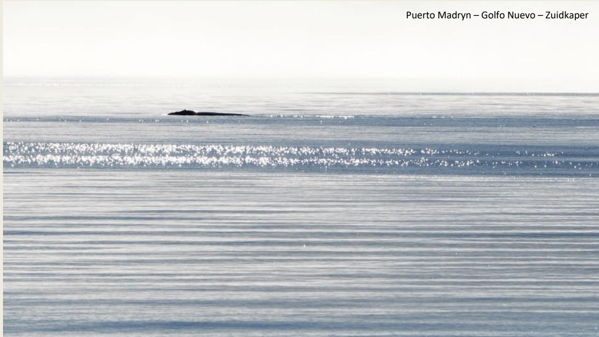
Puerto Madryn – Golfo Nuevo – Zuidkaper

Een complexe geologische voorgeschiedenis verwacht je niet meteen van een eindeloze vlakte zoals Patagonië. Toch is dat wel degelijk het geval, legt Leoni uit, terwijl we over mariene sedimentlagen uit Puerto Madryn wegklimmen.