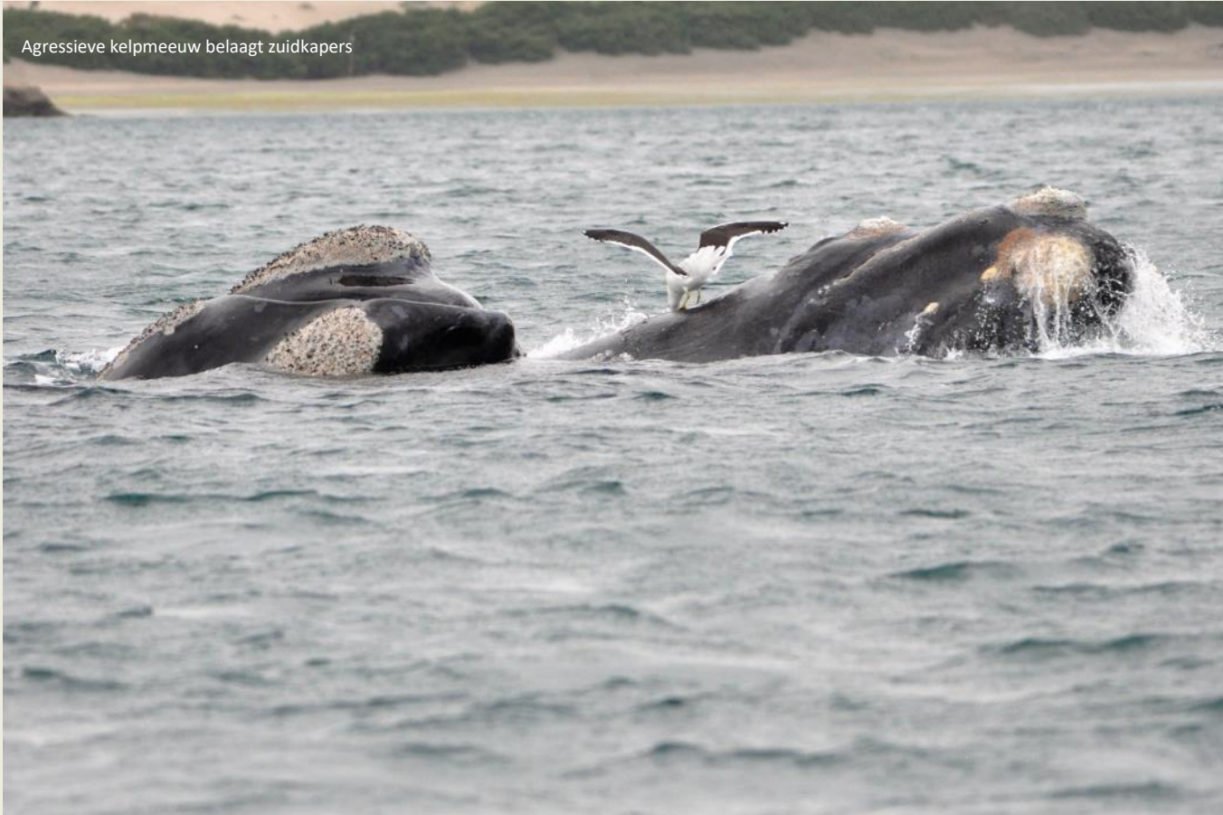
Agressieve kelpmeeuw belaagt zuidkapers