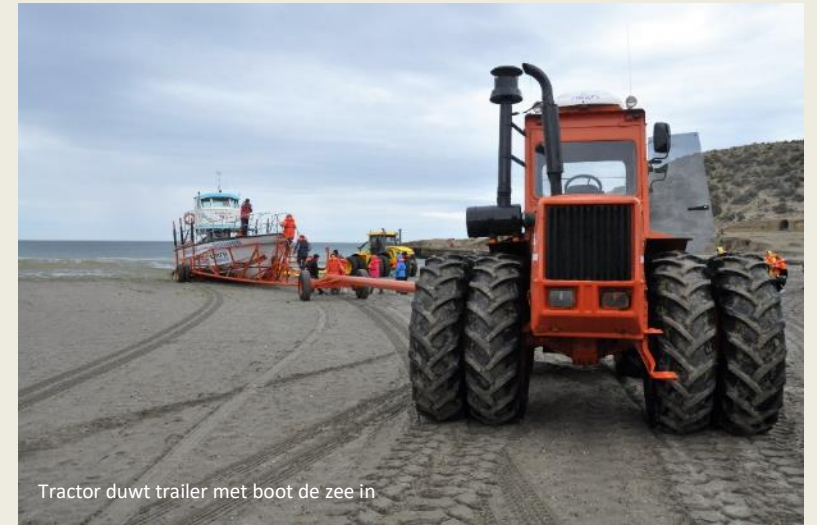
Tractor duwt trailer met boot de zee in

duizend kilometer vandaan – een knap staaltje navigatie. Daar danken ze hun naam zuidkapers aan. Eens ter plekke, zullen ze zich met krill voeden en zal ook de moeder weer aansterken.