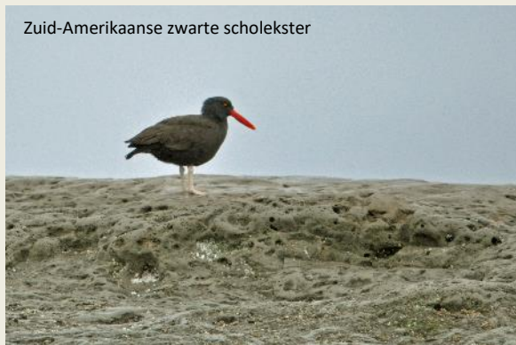
Zuid-Amerikaanse zwarte scholekster

weg gaat het nu naar Punta Delgada . Daar is het ons om de zeeolifanten te doen. Die zijn er nog, weet Leoni met zekerheid, al loopt het broedseizoen van september tot november en is het dus over zijn hoogtepunt heen.