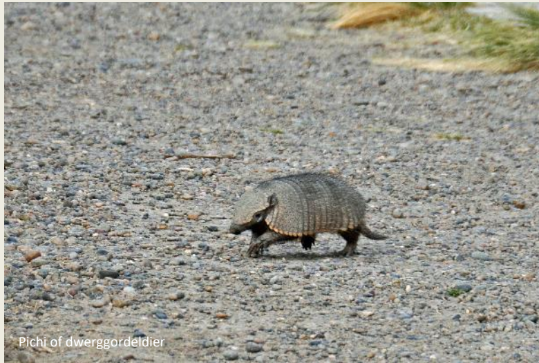
Pichi of dwerggordeldier