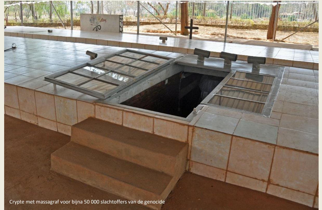
Crypte met massagraf voor bijna 50 000 slachtoffers van de genocide

Amper één dag later reeds hadden tienduizend Tutsi hier in Nyamata hun toevlucht gezocht. Aanvankelijk in het kerkgebouw, waarvan ze dachten dat het onschendbaar was.