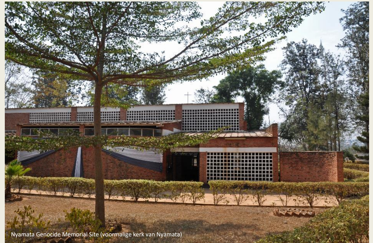
Nyamata Genocide Memorial Site (voormalige kerk van Nyamata)

Even voor half tien rijden we het hectische Kigali binnen. De zon heeft er vrij spel, enkele hoge cirruswolkjes vormen geen belemmering voor haar gulle stralen. Als een lappendeken van rode daken en bleke muren dijen