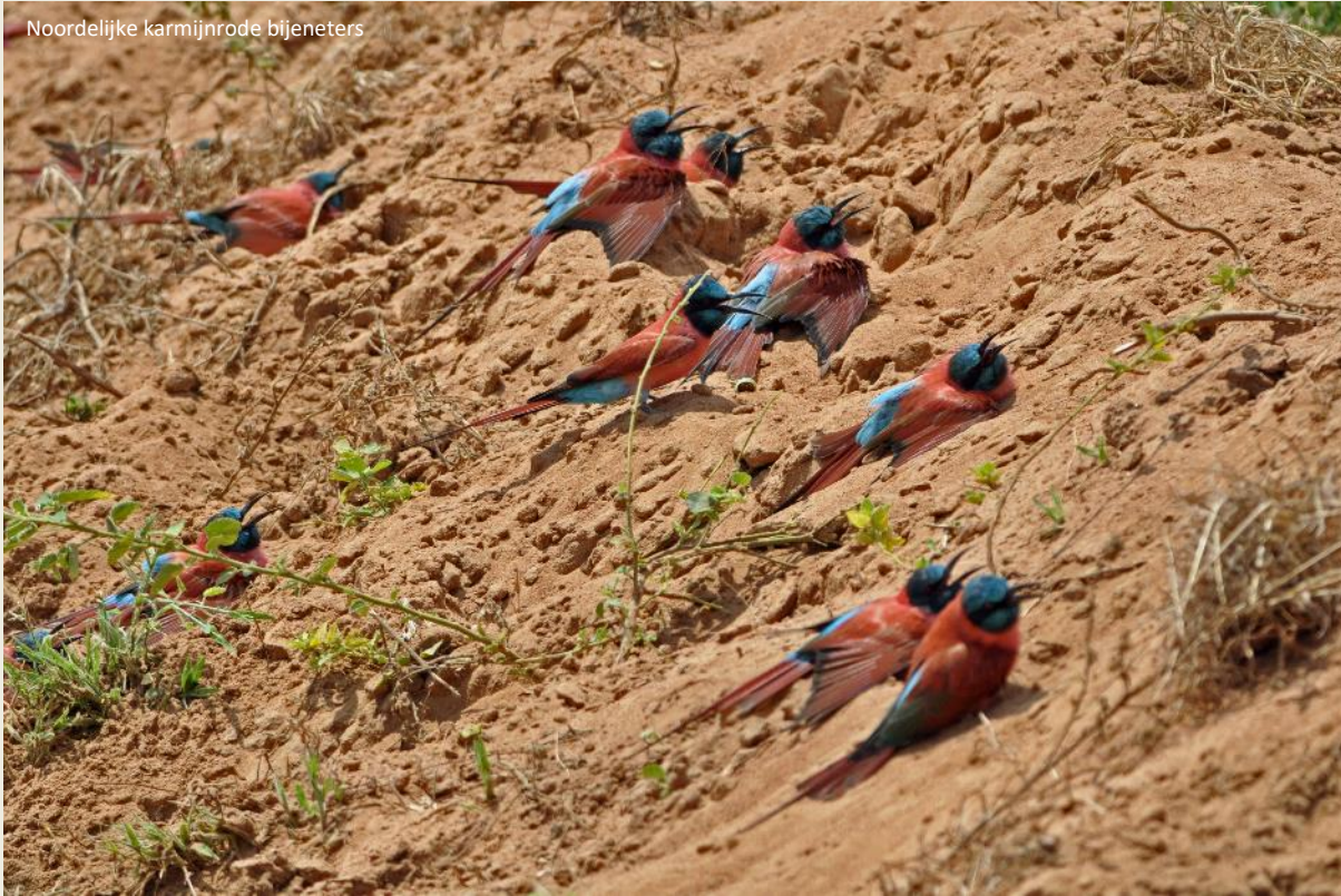
Noordelijke karmijnrode bijeneters

insecten en zelfs kleine zoogdieren te pakken te krijgen.