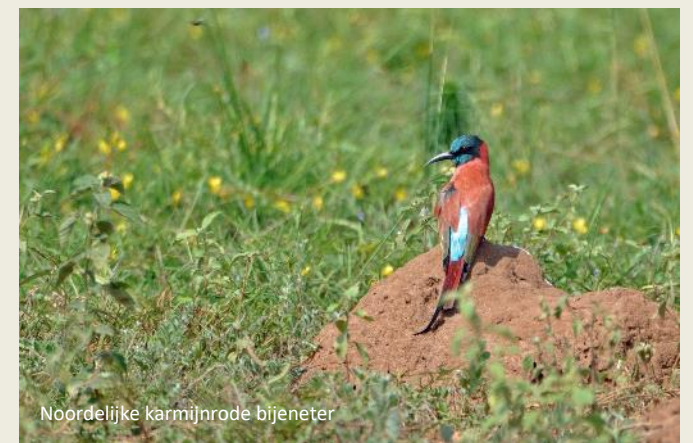
Noordelijke karmijnrode bijeneter