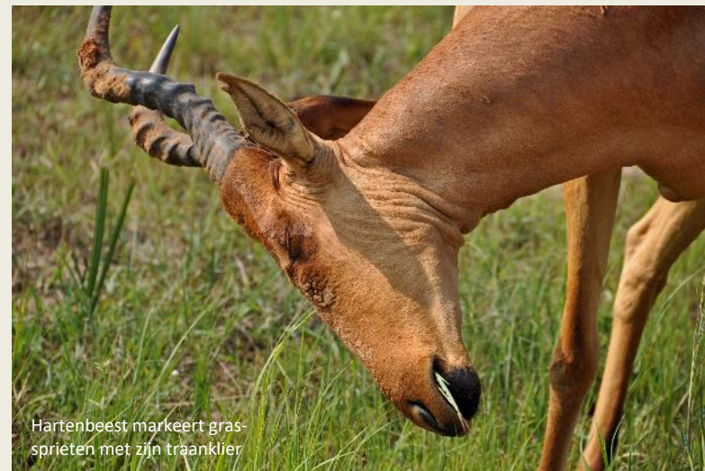
Hartenbeest markeert grassprietten met zijn traanklier

traanklieren markeren ze grassprietten om te communiceren met hun soortgenoten.