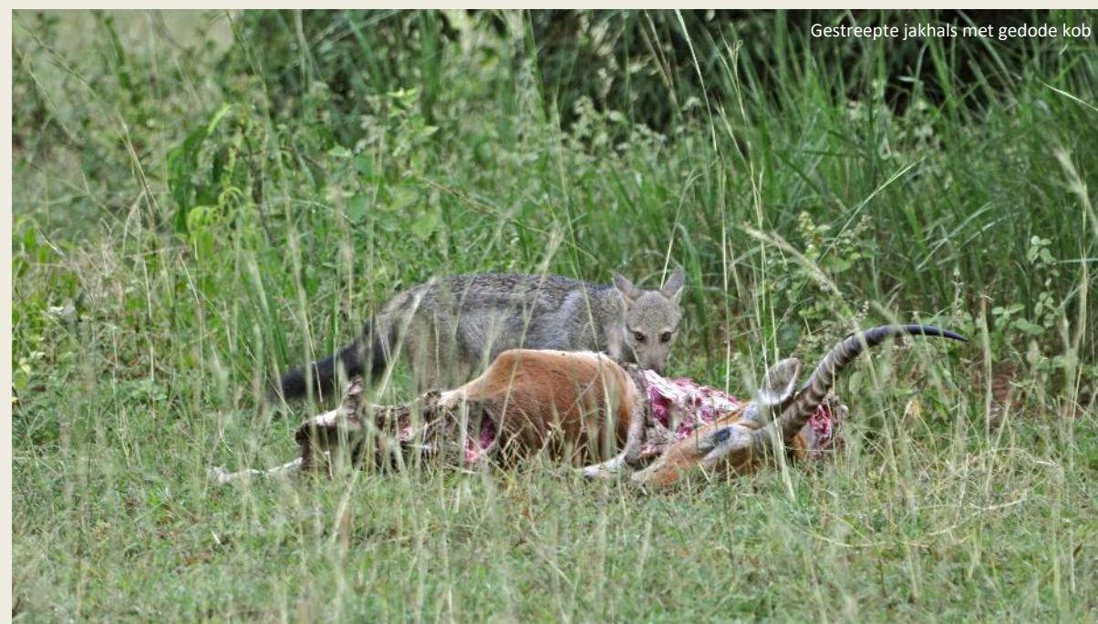
Gestreepte jakhals met gedode kob