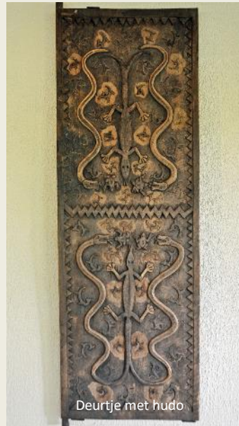
Deurtje met hudo

In de lobby zijn ze druk in de weer om het reusachtig bloemstuk van verse bloemen te voorzien. De traditionele kulintang staat er eventjes werkloos bij. Straks, als bezoekers arriveren, zal dit muziekinstrument met de