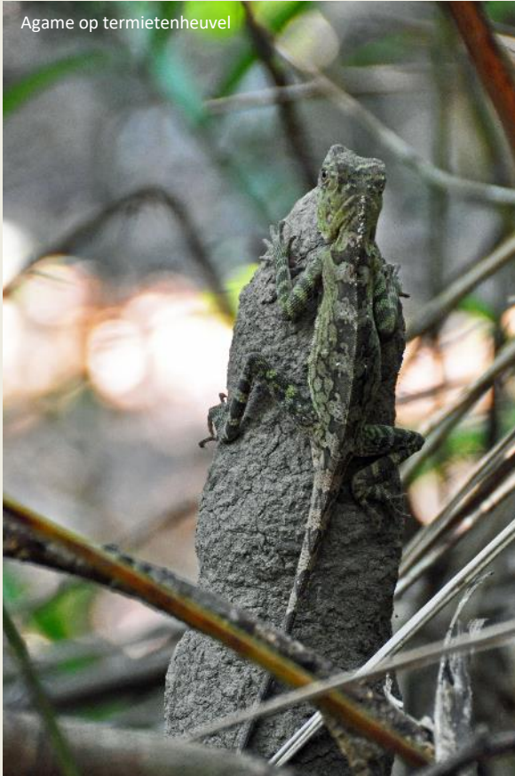
Agame op termietenheuvel