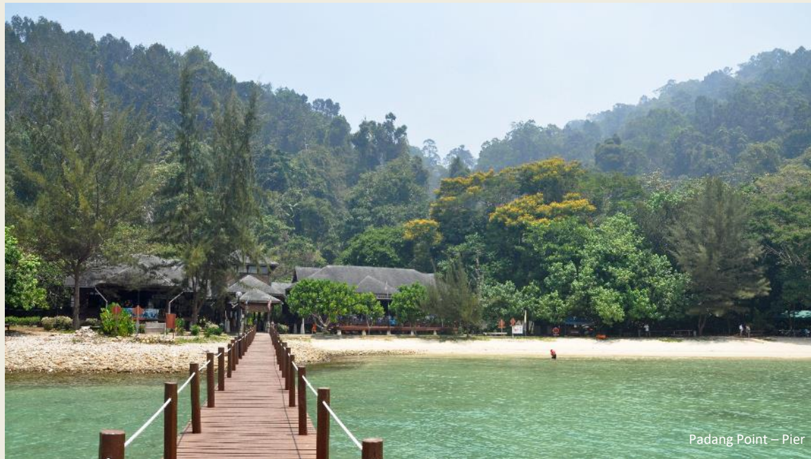
Padang Point – Pier

klanken van zijn acht gongs de lobby vullen.