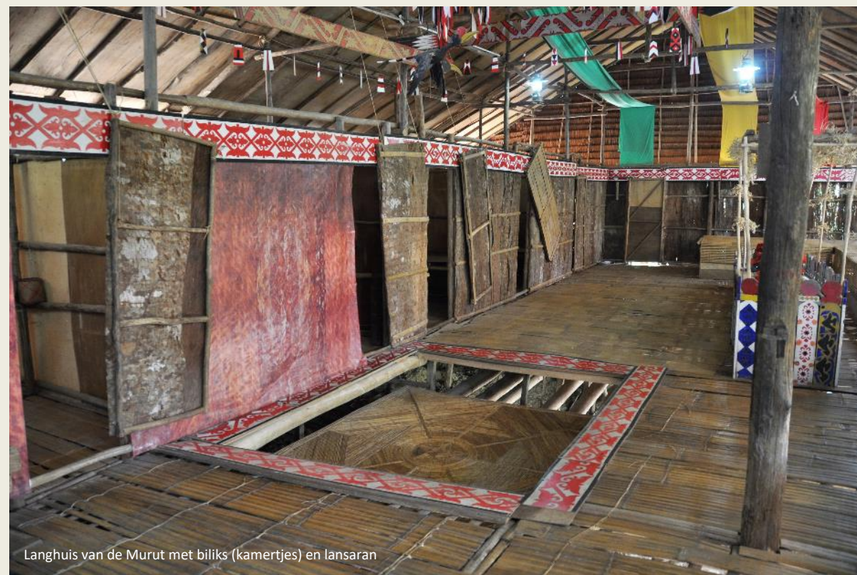
Langhuys van de Murut met biliks (kamertjes) en lansaran

Terug naar de langhuizen, want daar is het hier in feite om te doen. Hun naam doen ze alle eer aan, ze kunnen soms 250 m lang zijn.