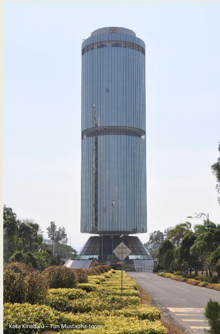
Kota Kinabalu – Tun Mustapha-toren

En ten slotte is er Oost-Maleisië. Samen met West-Maleisië , helemaal aan de overkant