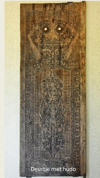
Deurtje met hudo