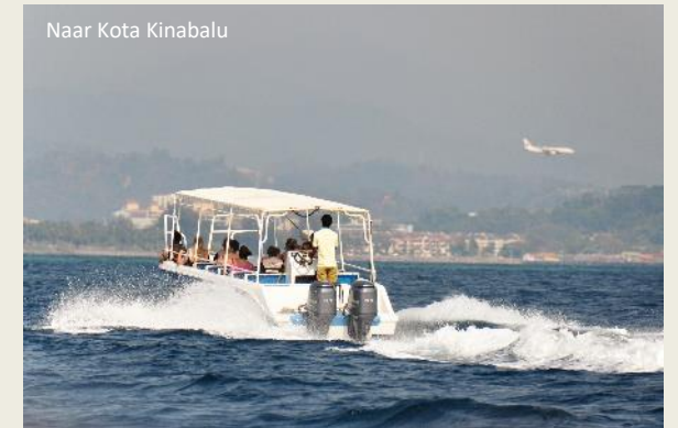
Naar Kota Kinabalu

Een watervaraan zit op de loer. Eén van de grootste hagedissen is dat, zijn lijf kan tot 60 cm lang worden – of anderhalve meter als je de staart meerekent. De omgeving van men-