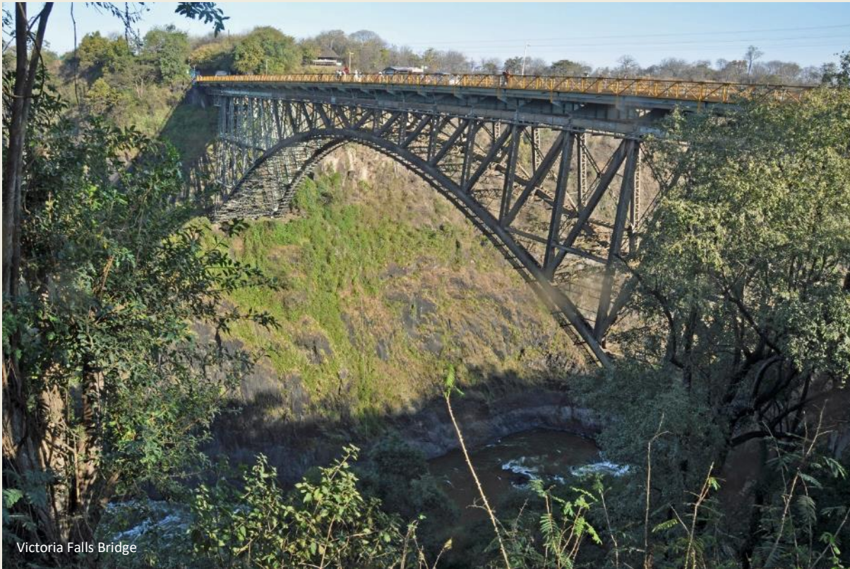
Victoria Falls Bridge

De wind laat zich ondertussen ten volle gelden en jaagt de waternevels onophoudelijk over de rand van de kloof. Zonder poncho lijkt je hier een verzopen kat. Toch kunnen we aan de overkant toeristen op Livingstone Island onderscheiden. Gehuld in poncho's, uiteraard.