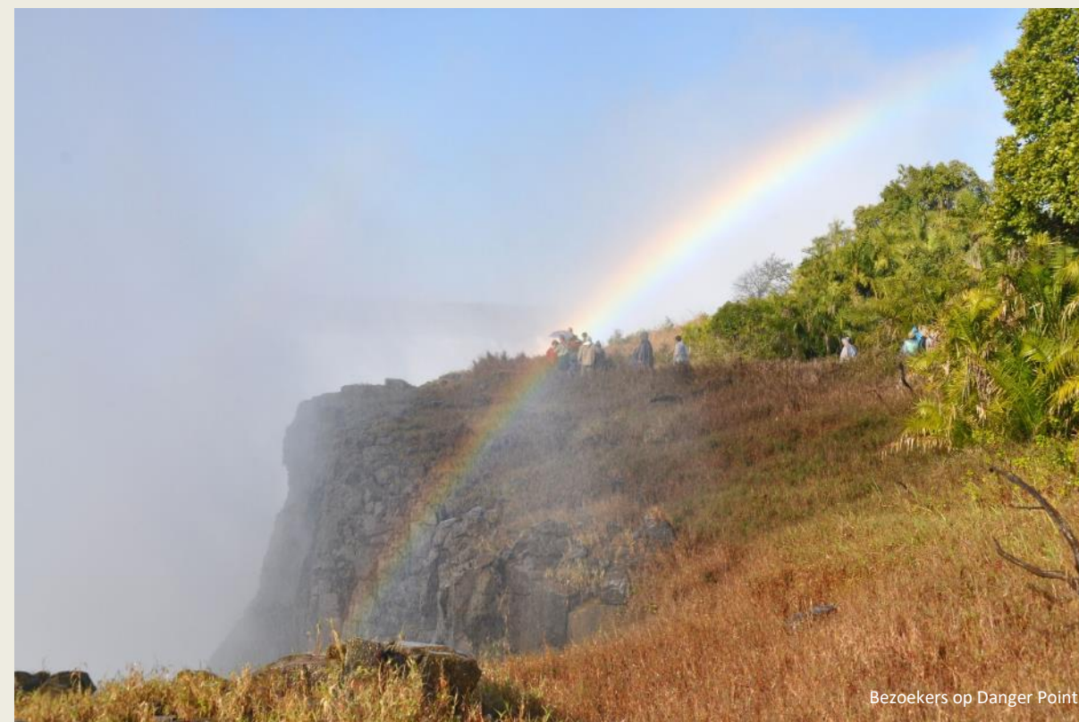
Bezoekers op Danger Point