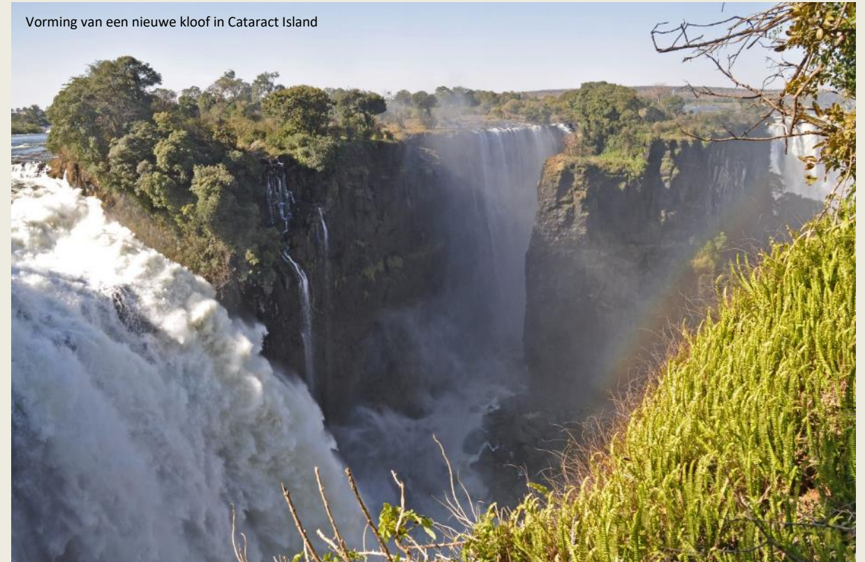
Vorming van een nieuwe kloof in Cataract Island

Het gebulder van water overheerst alles, maar een visueel beeld van de watervallen krijgen we voorlopig niet. Rond de kloof creëren de permanente waternevels immers een weelderig regenwoud. Enkel waar dat regenwoud een beetje terugwijkt, krijg je zicht op het spektakel. Maar zodra het regenwoud ons zijn eerste doorkijkje gunt, is het meteen raak.