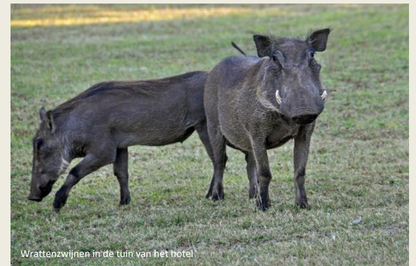
Wrattenzwijnen in de tuin van het hotel

Op de tafels staat het zurige zoelobier al op ons te wachten. Onze favoriete feestdrank