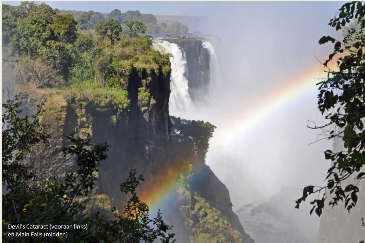
Devil's Cataract (vooraan links) en Main Falls (midden)