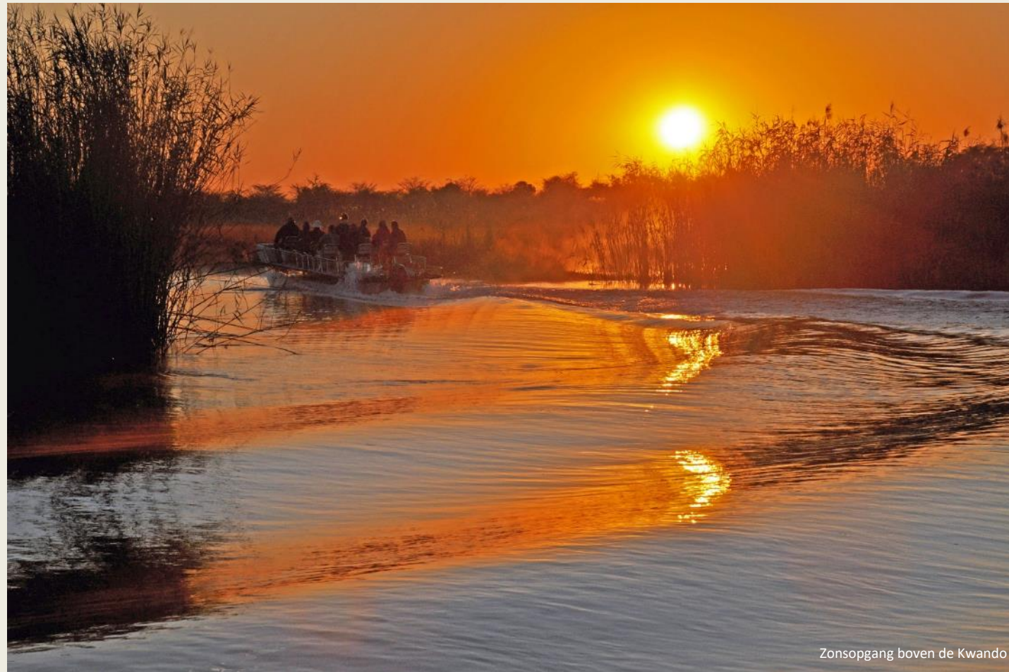
Zonsopgang boven de Kwando

De oostelijke horizon baadt in de koperen gloed van de rijzende zon wanneer we over de Kwando noordwaarts zoeven