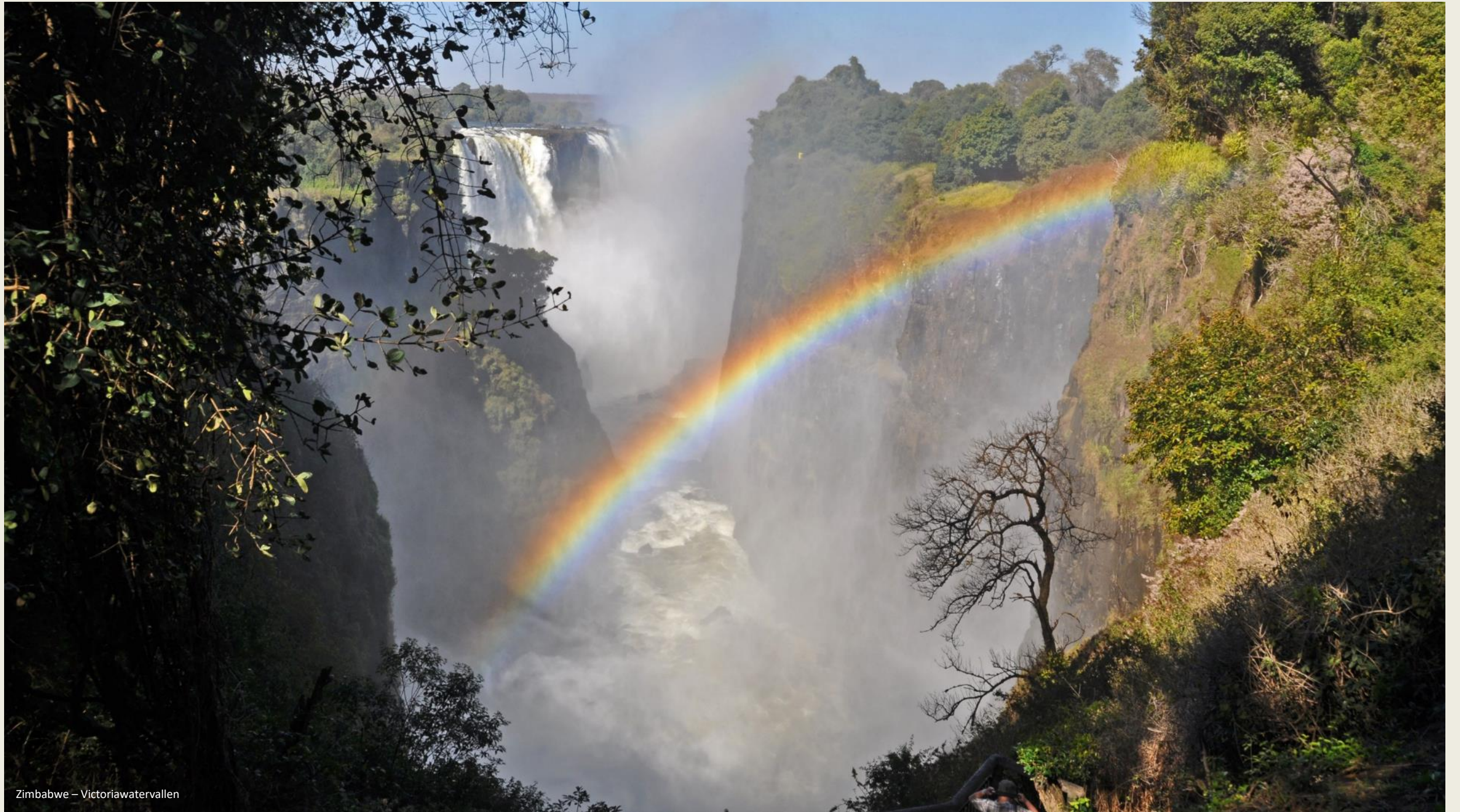
Zimbabwe – Victoriawatervallen