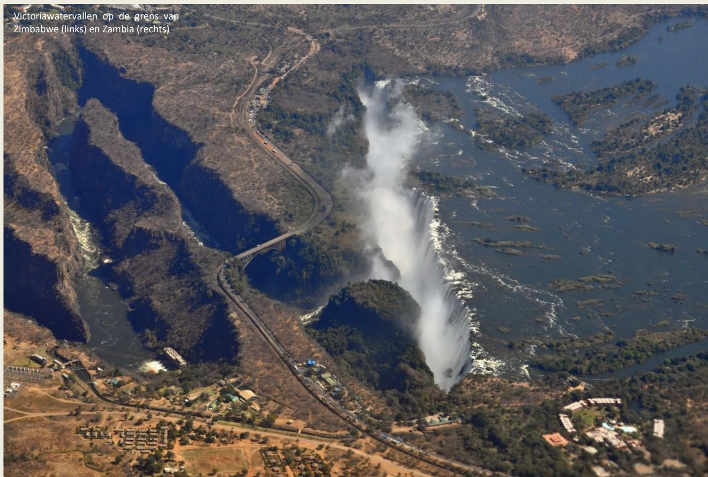
Victoriawatervallen op de grens van Zimbabwe (links) en Zambia (rechts)

Maar het loont de moeite. Eens de brug achter ons ligt, is het relatief droog. Nergens kom je dichterbij de watervallen dan hier. Het water dat aan de overkant over de richel stroomt, lijkt uit het niets te komen. We bevinden ons immers onder het