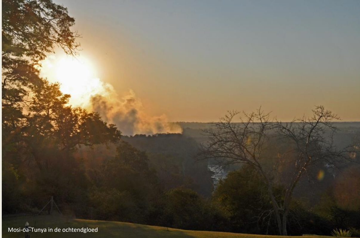
Mosi-oa-Tunya in de ochtendgloed

Een inferno, zo lijkt het, die torenhoge nevel die in een orgie van scherend licht uit het niets tevoorschijn komt