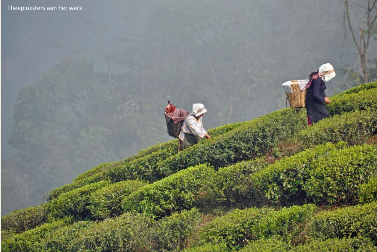
Theepluksters aan het werk

Toen de Nepalezen hun begerig oog op het welvarende Sikkim lieten vallen, was dat voor de Britten dan ook een godsgeschenk. De koning van Sikkim riep de Britten ter hulp. Die slaagden er in de Nepalezen af te houden, maar uiteraard was daar een prijs aan verbonden. Sikkim moest afstand doen van Darjeeling, vanaf 1835 maakte het gebied deel uit van het Britse rijk.