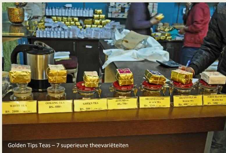
Golden Tips Teas – 7 superieure theevariëteiten