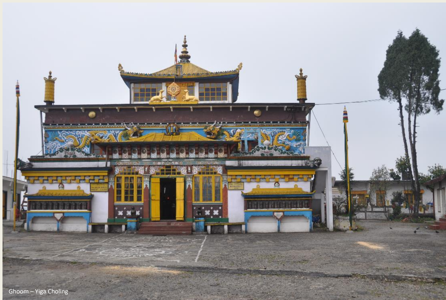
Ghoom – Yiga Choling

Negentwintig was Siddhartha toen hij met de natuur ging praten, zet Kabir zijn origineel