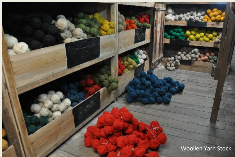
Woollen Yarn Stock