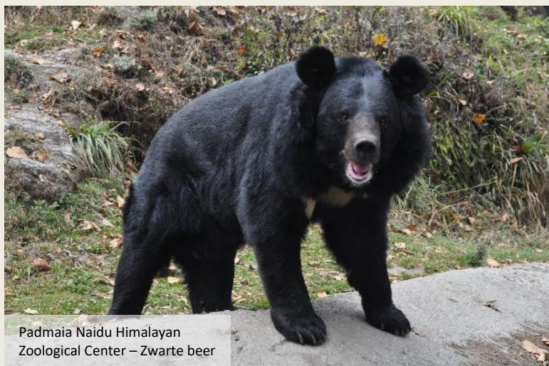
Padmaia Naidu Himalayan Zoological Center – Zwarte beer

De verdieping is volledig aan de moeizame verovering van de Everest gewijd. Mallory's fatale expeditie komt uitgebreid aan bod, evenals de vondst van zijn lijk. Met inbegrip van de macabere foto waarmee de Australische Herald Sun on Sunday op 9 mei 1999 op zijn voorpagina meende te moeten uitpak-