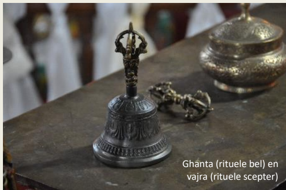
Ghanta (rituele bel) en vajra (rituele scepter)

Een opzichtige figuur in schreeuwerige kleuren boven de deur trekt onze aandacht. Een woeste god is er in een innige omhelzing met zijn shakti afgebeeld, zijn vrouwelijke kracht.