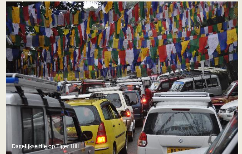
Dagelijkse file op Tiger Hill