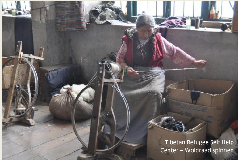
Tibetan Refugee Self Help Center – Woldraad spinnen