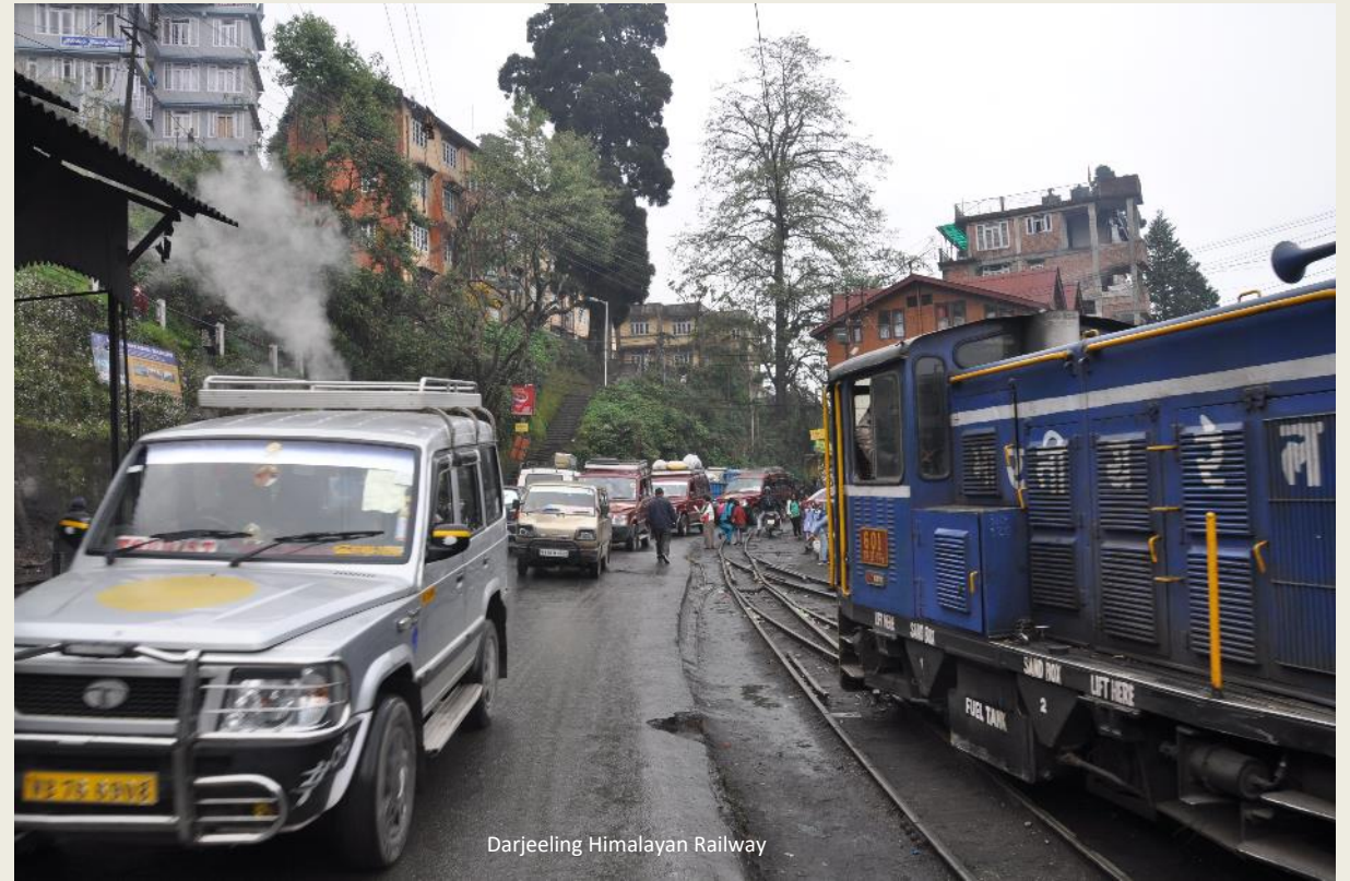
Darjeeling Himalayan Railway