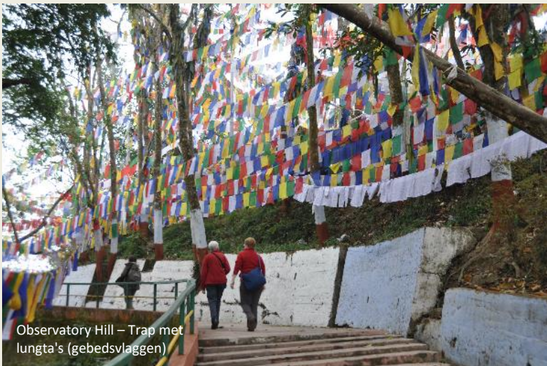
Observatory Hill – Trap met lungta's (gebedsvlaggen)

Een kleine tempel is aan de hindogodin Kali gewijd. Een woeste godin is dat, met haar valt niet te spotten. Maar ze hebben er wat op gevonden om haar bij voorbaat wat af te