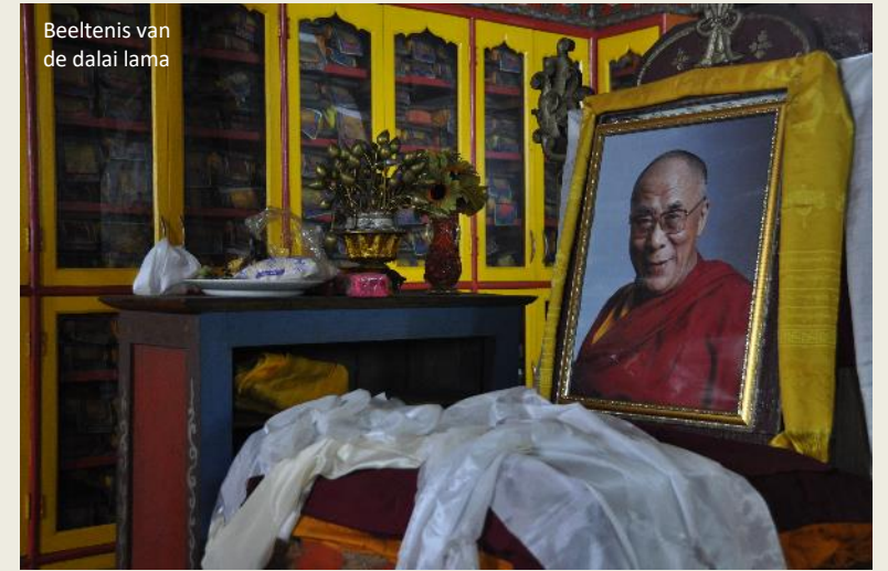
Beeltenis van de dalai lama

Ook Avalokiteshvara en Manjushri zijn van de partij. Avalokiteshvara is de bodhisattva van het mededogen, bij Manjushri kan je terecht voor wijsheid. Wat heiligen zijn voor het katholicisme, zijn bodhisattva's voor het boeddhisme.