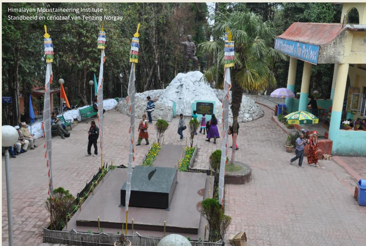
Himalayan Mountaineering Institute – Standbeeld en cenotaaf van Tenzing Norgay

Na hun exploit vestigde sherpa Tenzing zich in Darjeeling, waar hij in 1954 het Himalayan