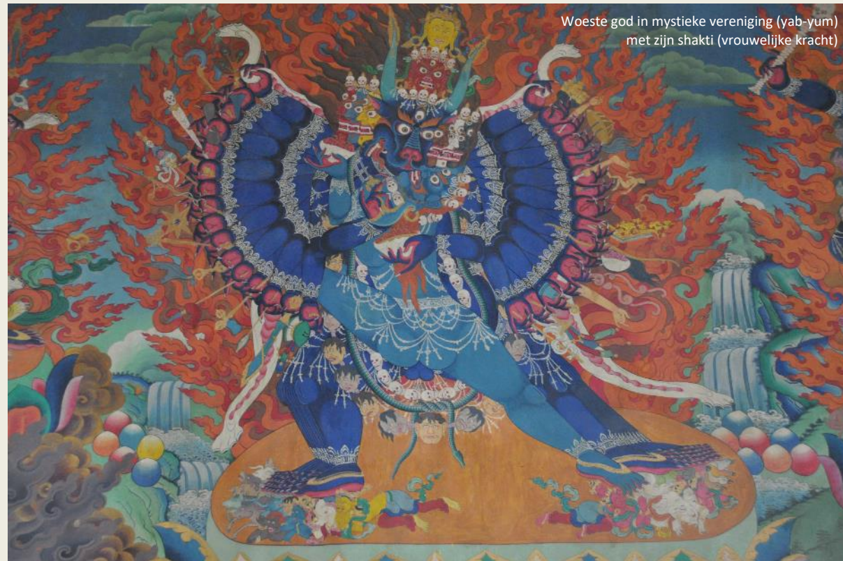
Woeste god in mystieke vereniging (yab-yum) met zijn shakti (vrouwelijke kracht)

De gebedshal ziet er vrij eenvoudig uit. Als eerste kennismaking met het boeddhistische