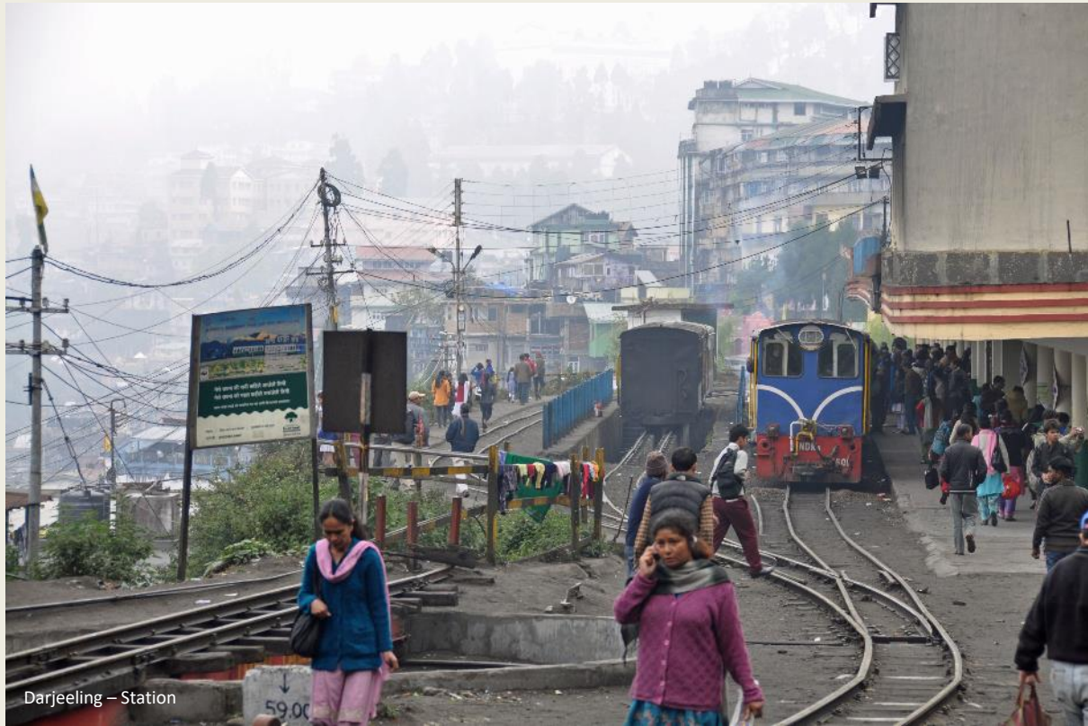
Darjeeling – Station