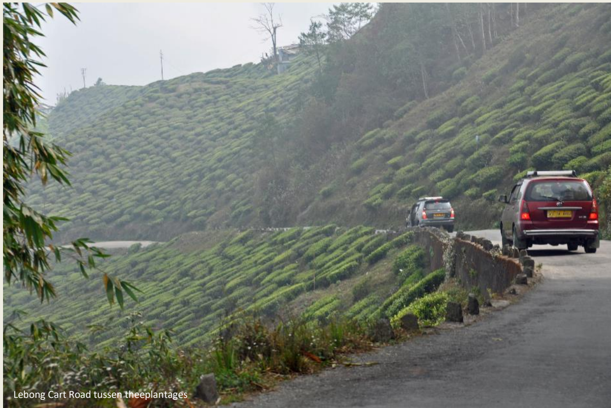
Lebong Cart Road tussen theeplantages

van zonovergoten theeplantages belanden met in de achtergrond een heilig landschap. Op de steile hellingen zijn theepluksters vlijtig aan de slag. Dit moet de eerste pluk zijn, zoveel hebben we er toch nog van begrepen. Voorzichtig plukken ze de rijpe blaadjes van de struiken. De tere blaadjes niet schenden, daar komt het immers op aan. Op hun rug hangt een gevlochten mand aan een riem die over hun voorhoofd gespannen is.