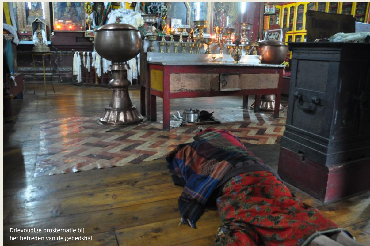
Drievoudige prostratie bij het betreden van de gebedshal

Wijze monniken bogen zich over het probleem. Voortschrijdend inzicht leidde tot het