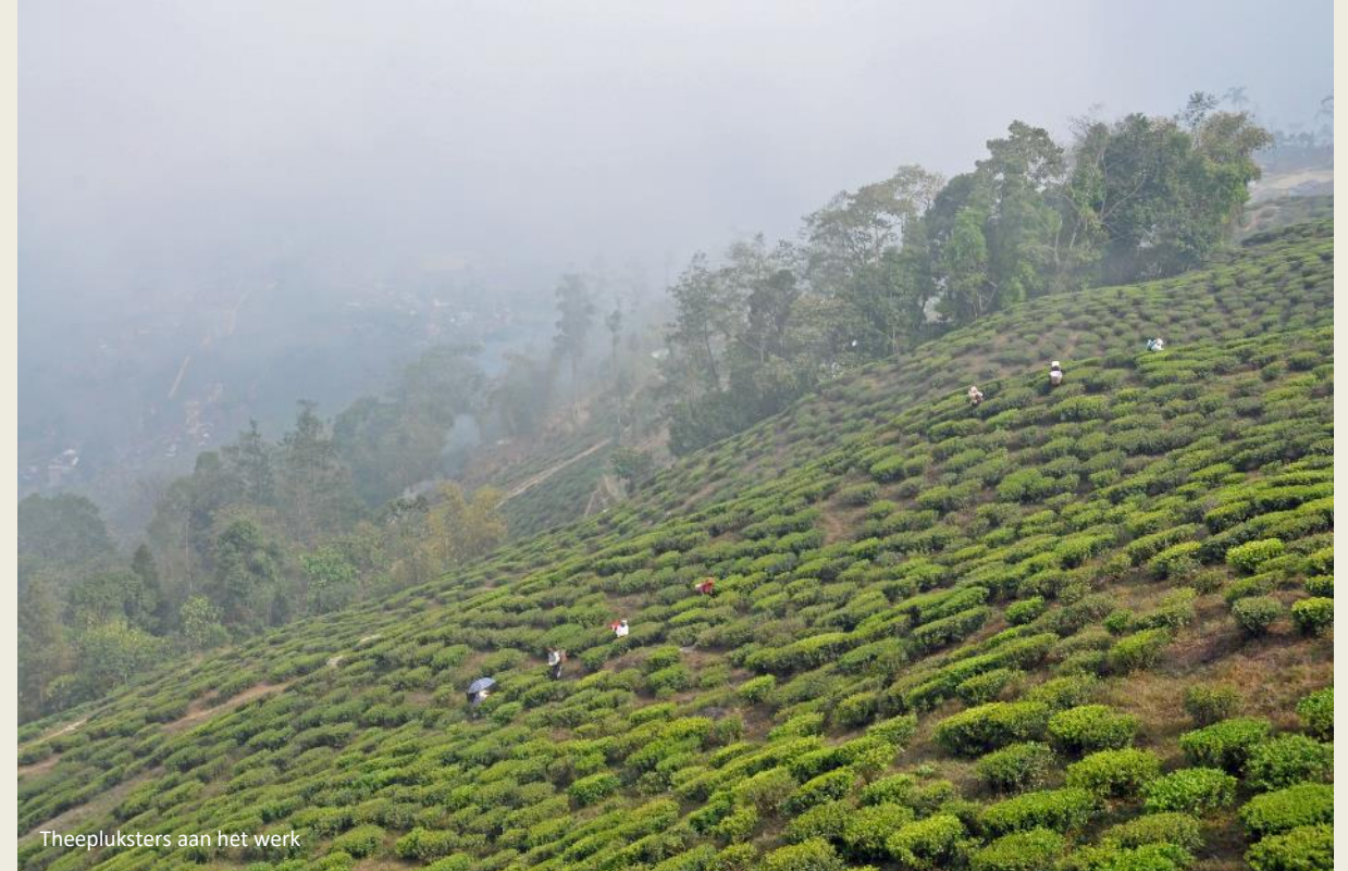
Theepluksters aan het werk

Wat later rijden we het domein van Jay Shree Tea & Industries binnen. Trots pakken ze er met hun slogan uit – None before us (1852) . Want niemand deed het hen voor, ze waren de allereersten om hier thee te verbouwen. Dat heeft hun geen windeieren gelegd – tegenwoordig brengt het domein van 474 hectaren jaarlijks 245 ton op.