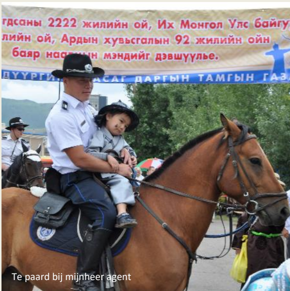
Te paard bij mijnheer agent