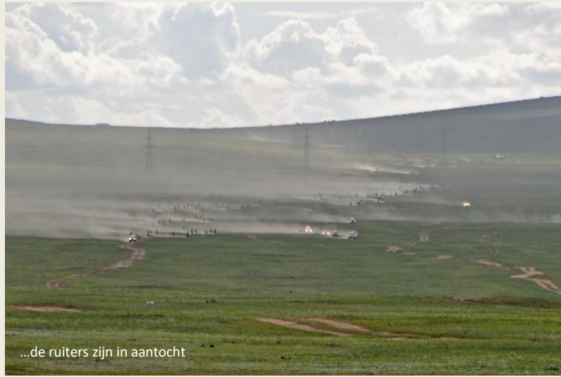
...de ruiters zijn in aantocht