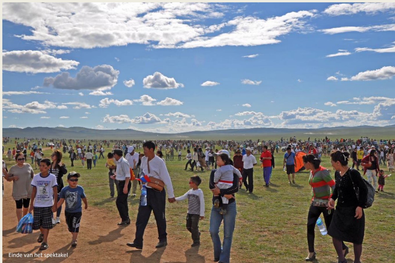
Einde van het spektakel

Twee paarden zonder ruiter draven enthousiast met de andere mee in de richting van de