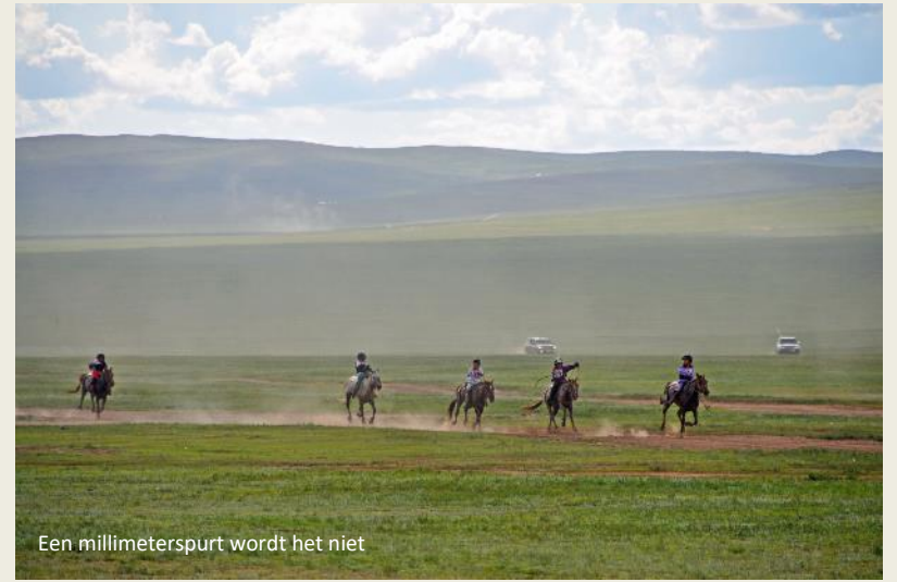
Een millimeterspurt wordt het niet

knipperen, is het de Arabier die op de grond ligt en de Mongool die in het zadel voort galoppeert.