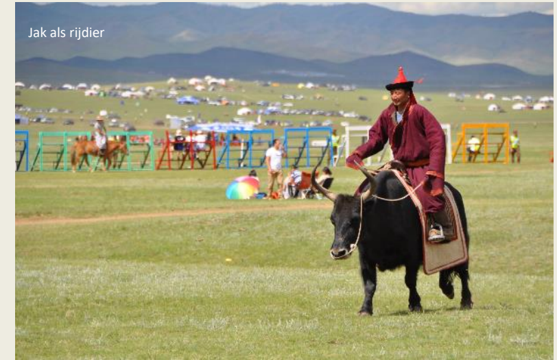
Jak als rijdier