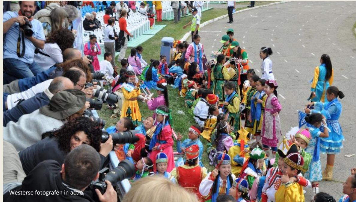
Westerse fotografen in actie

Vanaf kwart voor tien zwaaien de deuren open. We nemen onze overdekte zitplaatsen aan het zuidoostelijke uiteinde van het stadion in en laten de omgeving op ons inwerken. Langs alle kanten stroomt het volk het stadion binnen. Piekfijn uitgedost zijn ze, ze vullen de tribunes tot de nok met hun bonte kostuums.