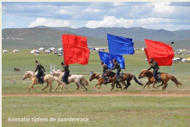
Animatie tijdens de paardenrace