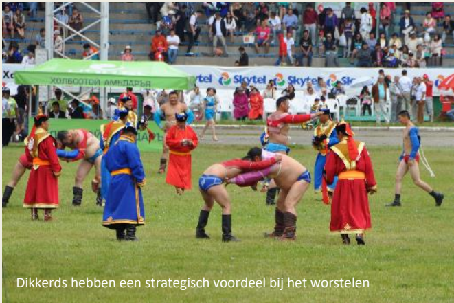
Dikkerds hebben een strategisch voordeel bij het worstelen

wordt in de eerste ronde gevloerd, ook al hebben sommigen het knap lastig met hun dunne tegenstander. Pas morgenavond zal de finale uitwijzen wie de winnaar is.