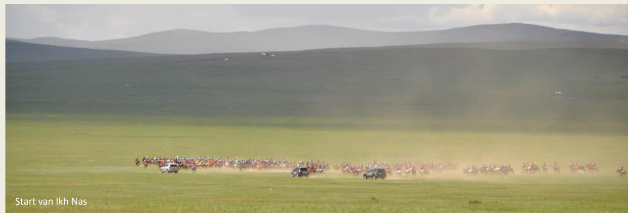
Start van Ikh Nas

Dat het in deze hectische toestand aan de rand van de stad tot een botsing komt, verbaast ons allerminst. Een kleine personenwagen is door een terreinwagen in de linkerflank gegrepen. De schade lijkt onherstelbaar. Beduusd zit de bestuurder van de personenauto op de grond, de handen voor het gelaat. Naadam 2013 zal hij niet zo snel vergeten.