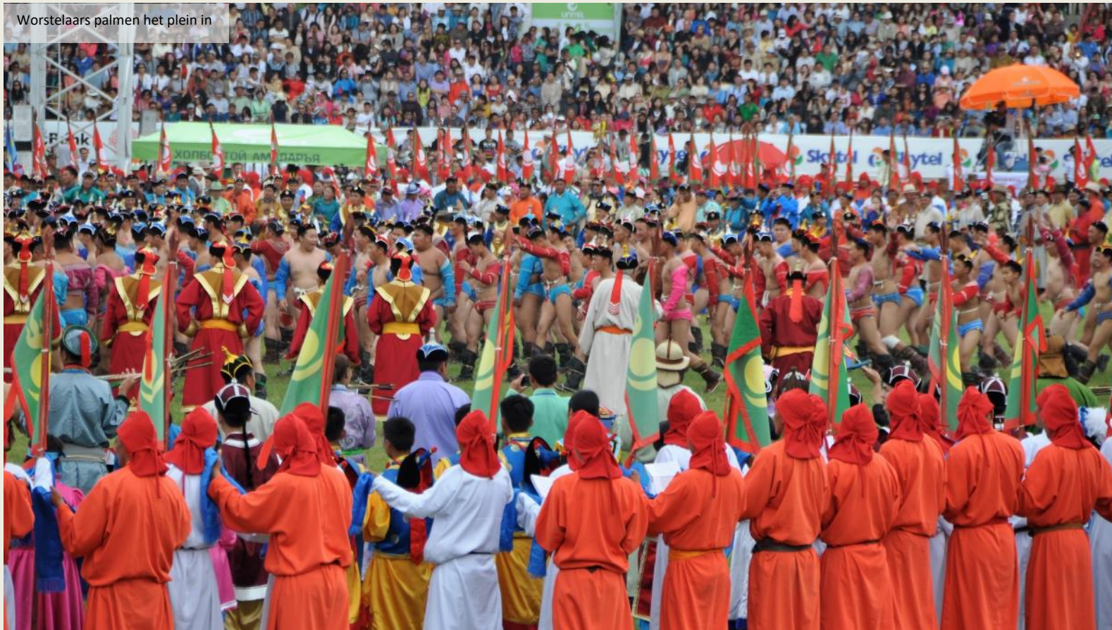
Worstelaars palmen het plein in

Ten slotte nemen de worstelaars en de boogschutters het terrein in. Na ruim een uur is het openingspektakel ten