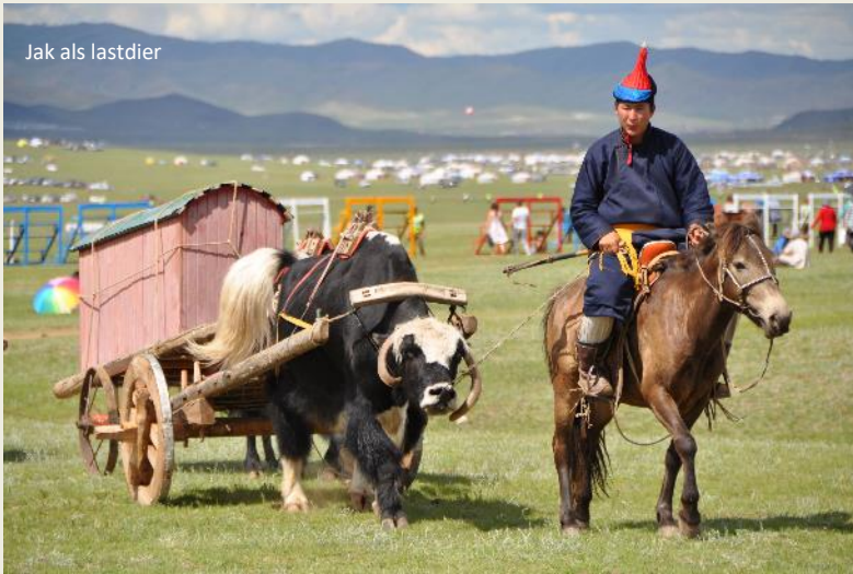
Jak als lastdier