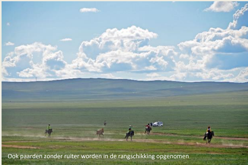
Ook paarden zonder ruiters worden in de rangschikking opgenomen