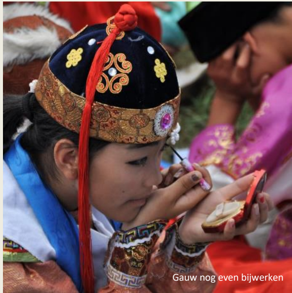
Gauw nog even bijwerken