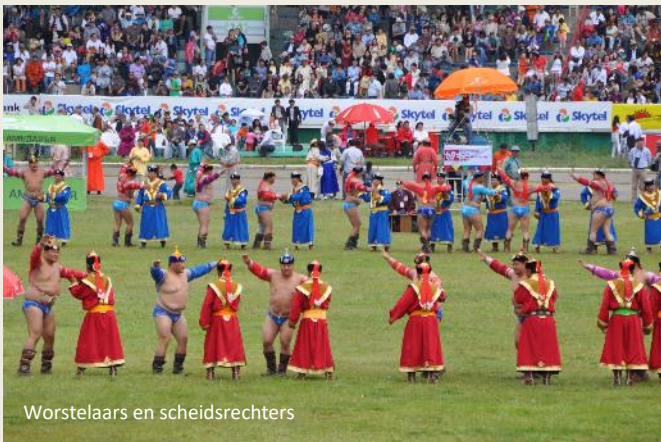
Worstelaars en scheidsrechters