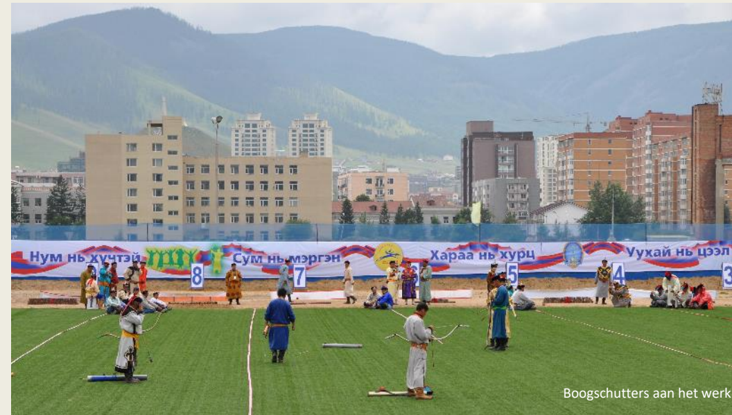
Boogschutters aan het werk

vebogen in composietmaterialen en pijlen met stompe punten mikken de boogschutters op vijftien blokjes die in een aaneengesloten rij in het zand liggen. Het middelste blokje raken is de bedoeling. Een beetje zoals bij de liggende wip, maar dan op de grond. Scheidsrechters houden zich griezelig dicht bij de doelwitten op. Telkens een