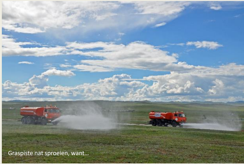
Graspiste nat sproeien, want...