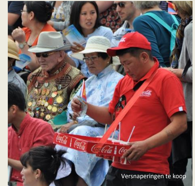
Versnaperingen te koop

Op het grasveld wordt de laatste hand gelegd aan de kleine podia. Cameramensen op grote podia testen hun apparatuur. De fanfare installeert zich. Vier reuzegrote ballonnen – groen, geel, blauw, rood – bakenen de hoeken van het terrein af.