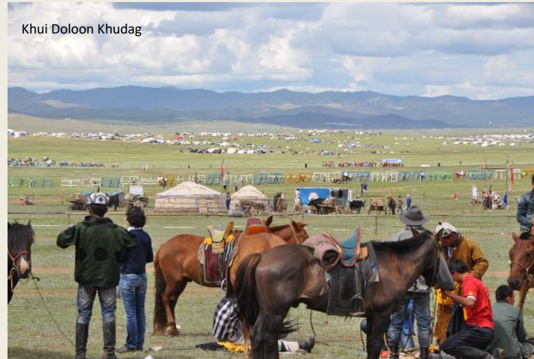
Khui Doloon Khudag