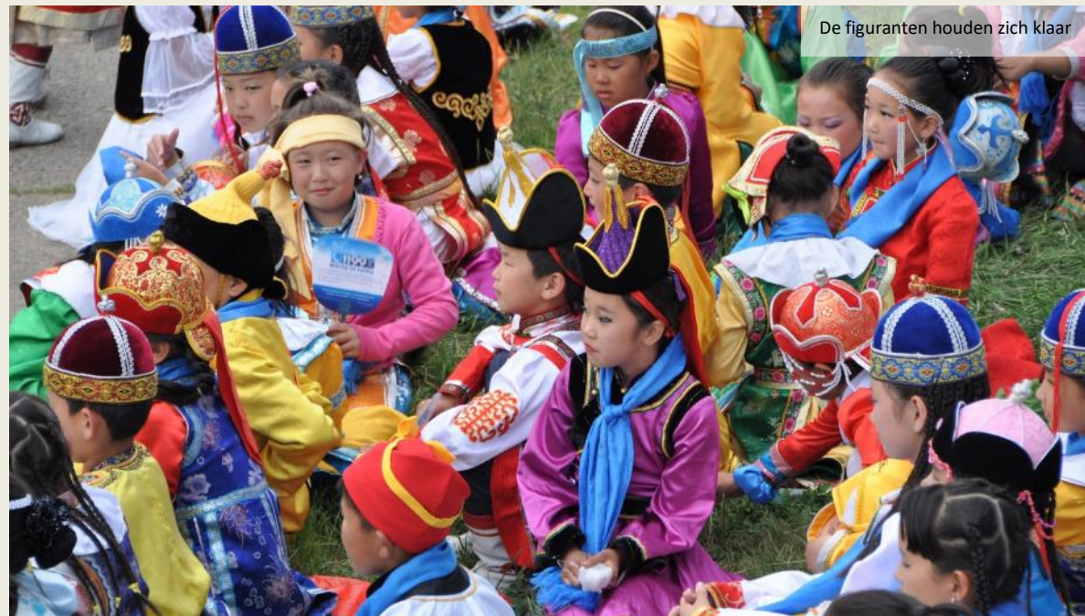
De figuranten houden zich klaar