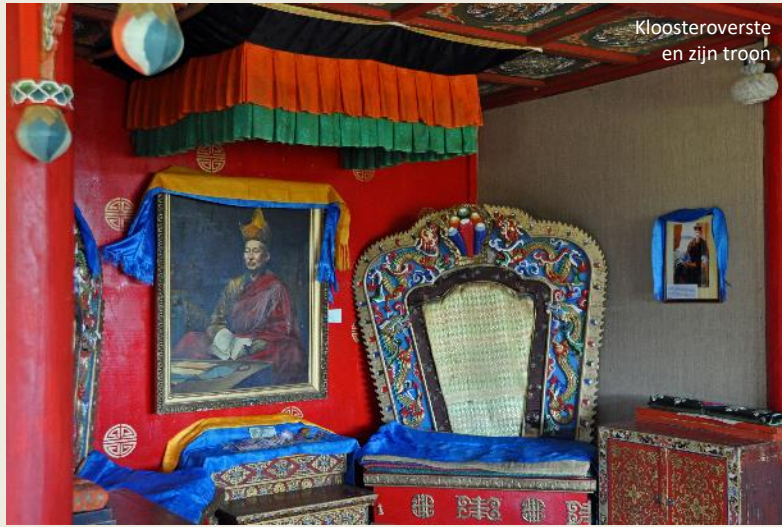
Kloosteroverste en zijn troon