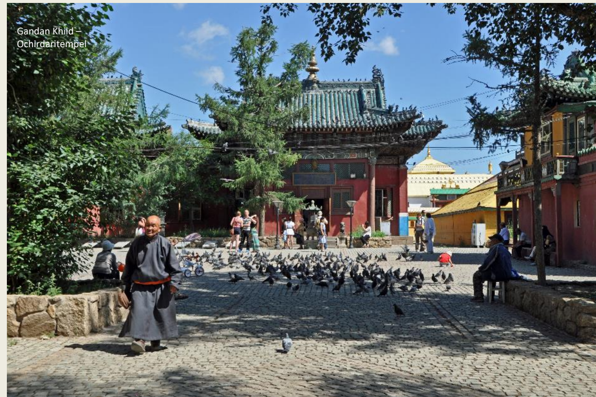
Gandan Khiid – Ochirdaritempel

Honderden duiven rekenen het binnenpleintje tot hun privédomein. Een handvol houten ligbedjes staan voor de Ochirdaritempel opgesteld. Een eeuwenoude traditie is het bij Tibetaanse pelgrims om zich voor een tempel te prosterner, zich plat op de buik te werpen, de armen biddend boven het hoofd uitgestrekt. In Tibet doen ze dat op de barre grond, hier moeten de ligbedjes de uitvoering van het ritueel wat comfortabeler maken. Kennelijk overtuigt