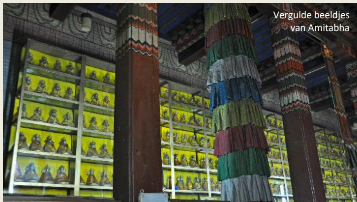
Vergulde beeldjes van Amitabha

roodbruine houten bovenbouw en de vergulde herten aan weerszijden van een dharma-chakra , een Wiel van de Wet , waarvan de