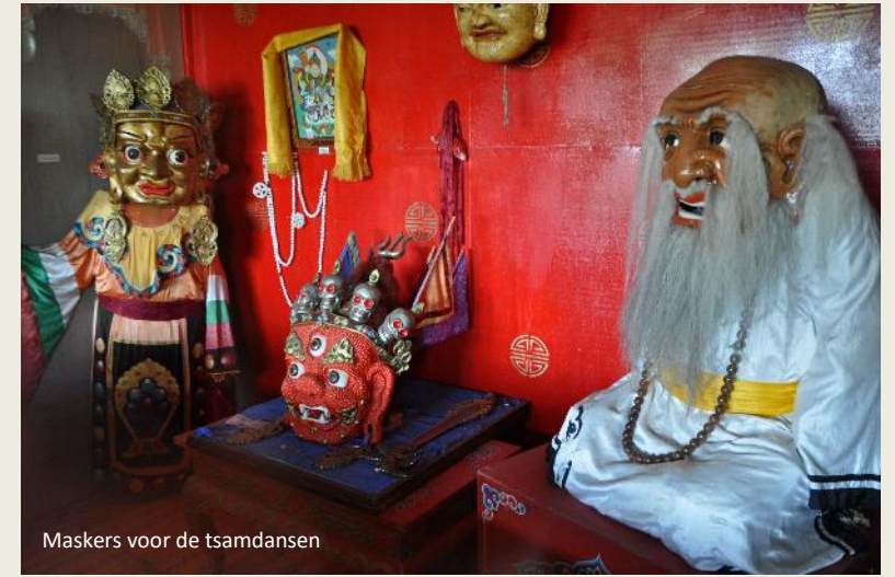
Maskers voor de tsamdansen

In 1937 vonden de Russen het nodig daar korte metten mee te maken. Alle monniken werden geëxecuteerd, alle gebouwen verwoest. In tegenstelling tot Gandan Khiid is Mandshir Khiid die slag nooit te boven gekomen – Gandan Khiid lag dicht bij de hoofdstad, Mandshir Khiid lag een eind buiten de beschaafde wereld. Eén tempel werd in 1992 als museum heropgebouwd, alle andere gebouwen liggen nog steeds in puin. Onlangs werd in de buurt een massagraf gevonden. Alle schedels vertoonden een gat in het voorhoofd, weet Batmunkh.