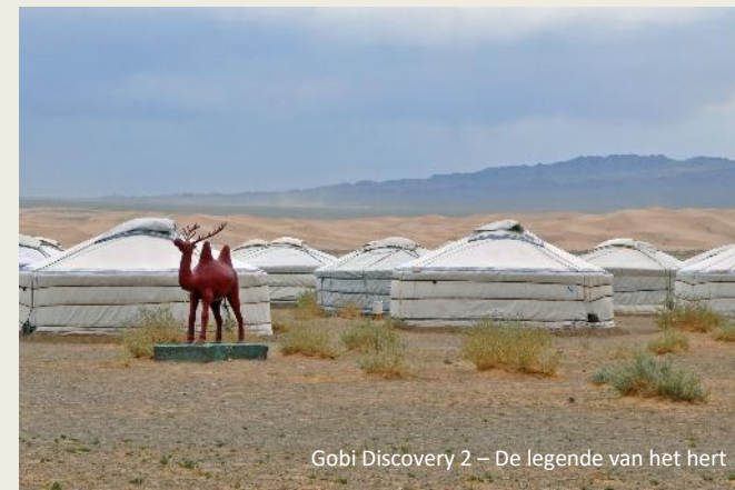
Gobi Discovery 2 – De legende van het hert

Van op een helling kijken 42 gers over Khongoryn Els uit. Binnen treffen we de vertrouwde rudimentaire meubeltjes aan, inclusief plankharde bedden en kussens gevuld met pitten. Van het karrenwiel in de nok daalt een dik touw neer met een joekel van een steen er