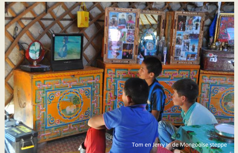
Tom en Jerry in de Mongoolse steppe