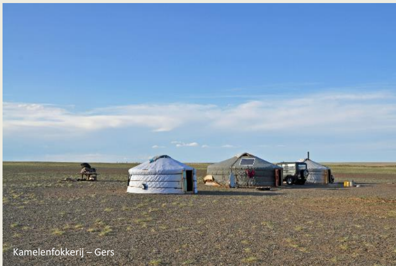
Kamelenfokkerij – Gers