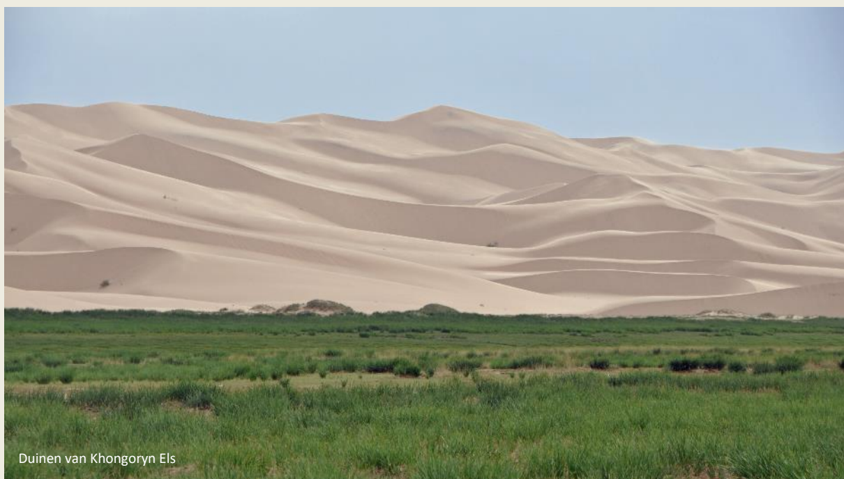
Duinen van Khongoryn Els

strekken de zandduinen zich over de lengte van de vallei uit, soms over een breedte van twaalf kilometer. Op sommige punten bereiken ze een hoogte van driehonderd meter.