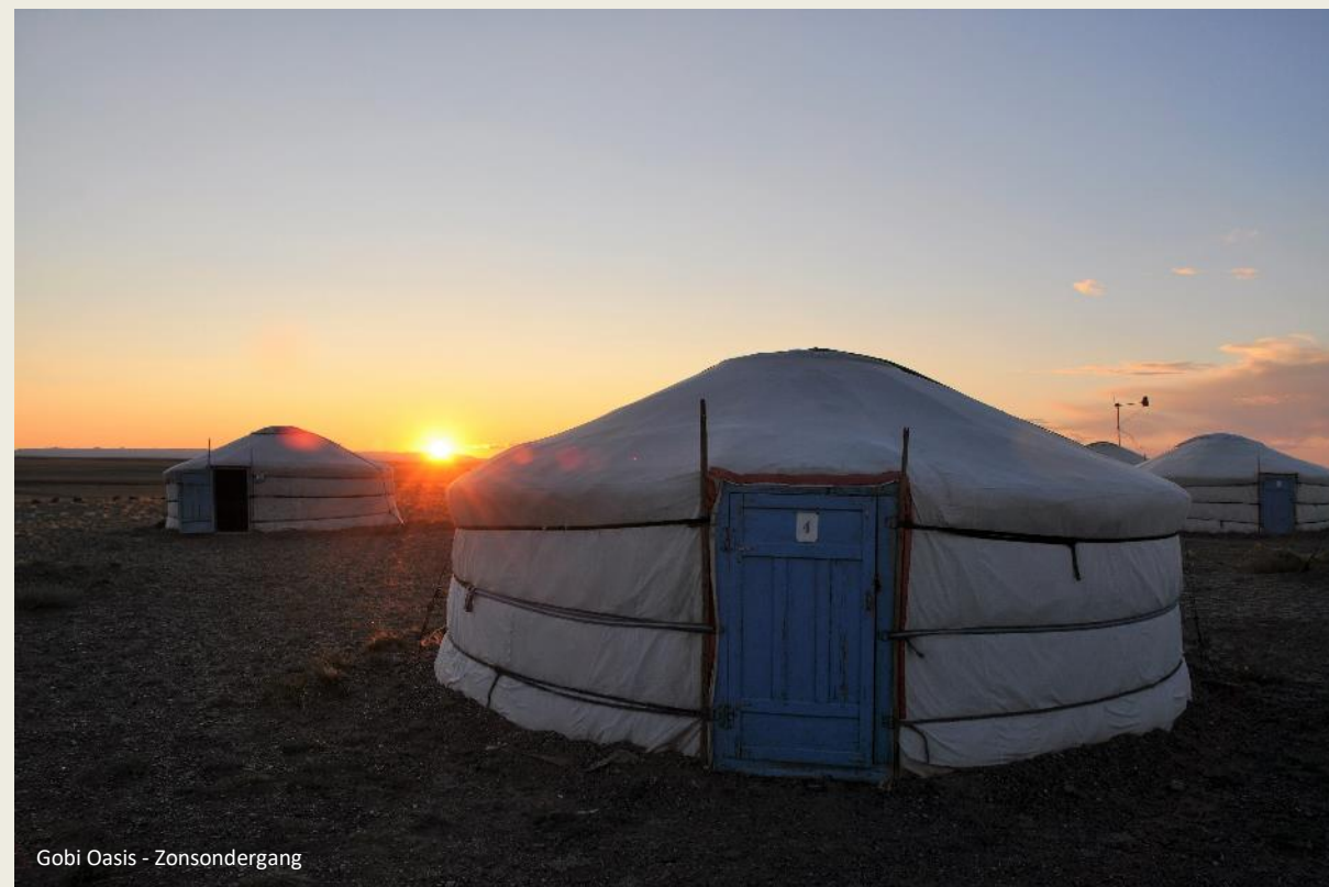
Gobi Oasis - Zonsondergang

Jaarlijks dokt Munkh Erdenet 1,3 miljoen tugrik af voor de huisvesting van de oudste drie kinderen in Ulaanbaatar – ruim 700 euro. Omdat ze hun kot delen, valt dat nog mee. Eten is daar niet in meegerekend, inschrijvingsgeld ook niet. Dat laatste komt nog eens op 0,9 tot 1,2 miljoen tugrik per jaar.