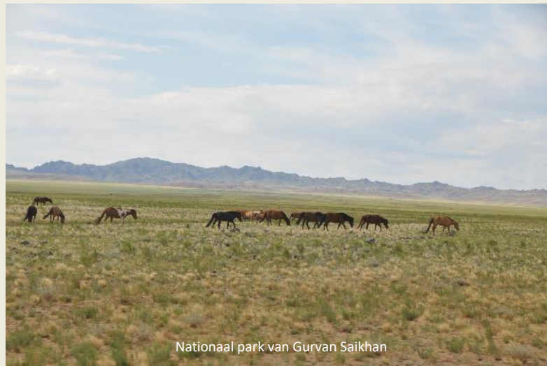
Nationaal park van Gurvan Saikhan