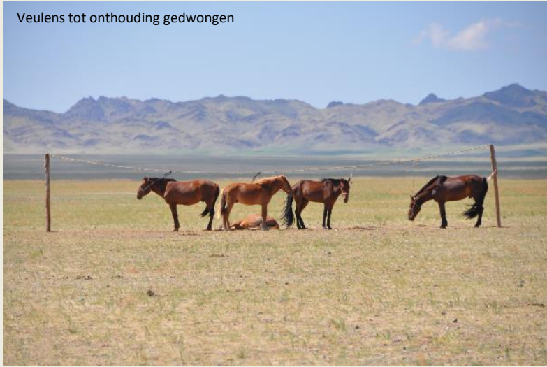
Veulens tot onthouding gedwongen