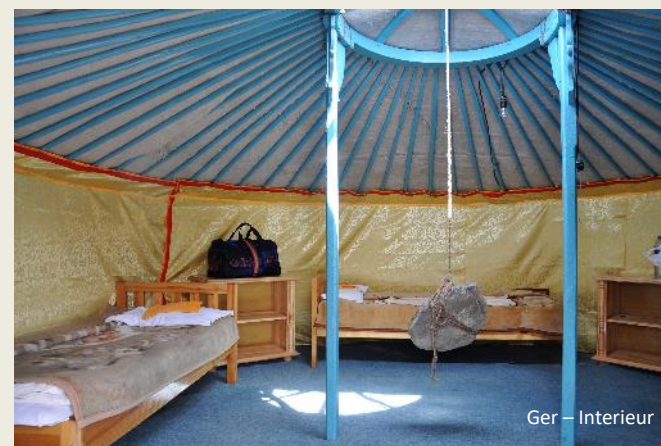
Ger – Interieur