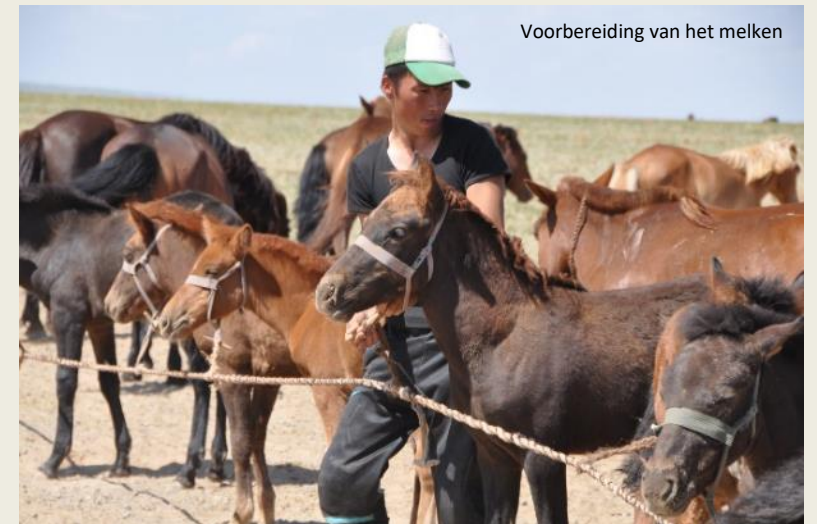
Vorbereitung van het melken