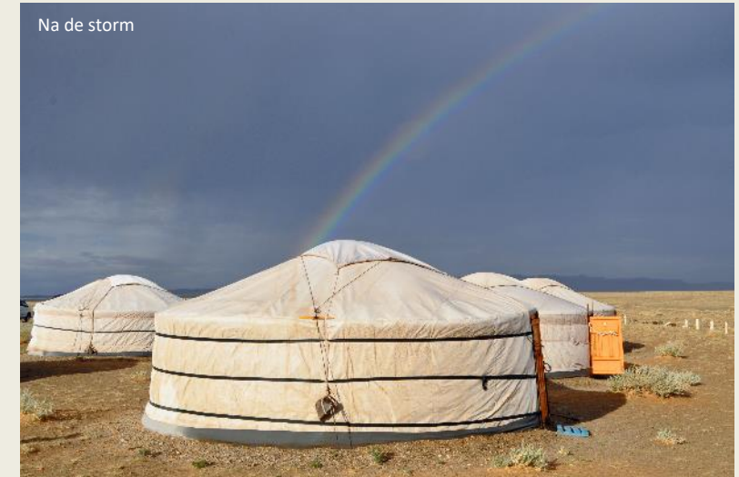
Na de storm

de helling neemt slechts matig toe. Rustig stappen we naar boven, de sterke wind krijgt ons niet klein. Maar de helling wordt steil, het zand mul, de wind ongenadig. Stappen wordt een processie van Echternach. Onze huid wordt gezandstraald, met elke ademtocht hijgen we wolkjes zand naar binnen. Zandkorrels nestelen zich tussen onze tanden, op onze oogleden, in onze longen.