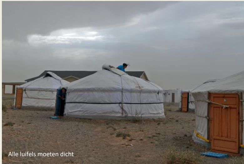
Alle luifels moeten dicht