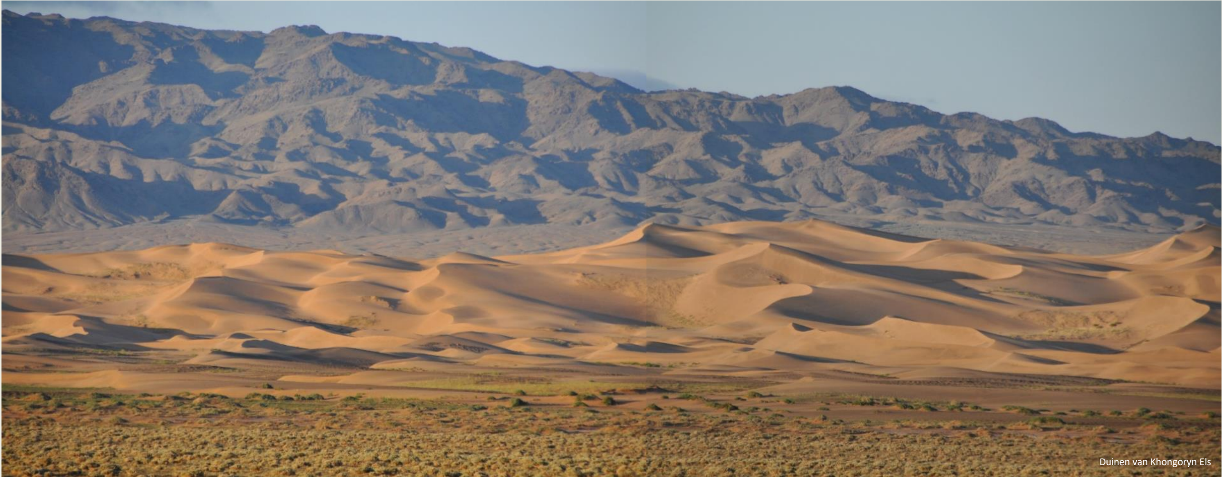
Duinen van Khongoryn Els