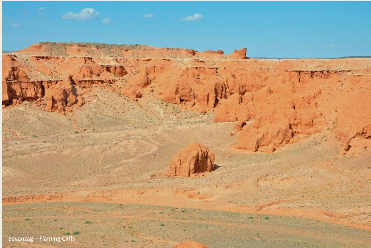
Bayanzag – Flaming Cliffs

Niet dat er in de Gobi tijdens het Krijt – tussen 114 en 65 miljoen jaar geleden – beduidend meer dinosaurussen zouden rondgelopen hebben dan elders ter wereld. Wat de Gobi evenwel zo speciaal maakt, is de sterke erosie die voortdurend nieuwe sedimenten uit het Krijt blootlegt. En het zijn precies die sedimenten die skeletten van dinosaurussen bevatten. Dat er zo weinig vegetatie is en dat de Gobi Altaj nog steeds omhooggestuwd wordt, versnelt dit proces zelfs.