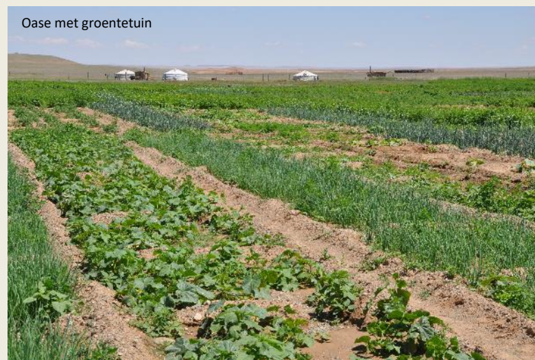
Oase met groentetuin