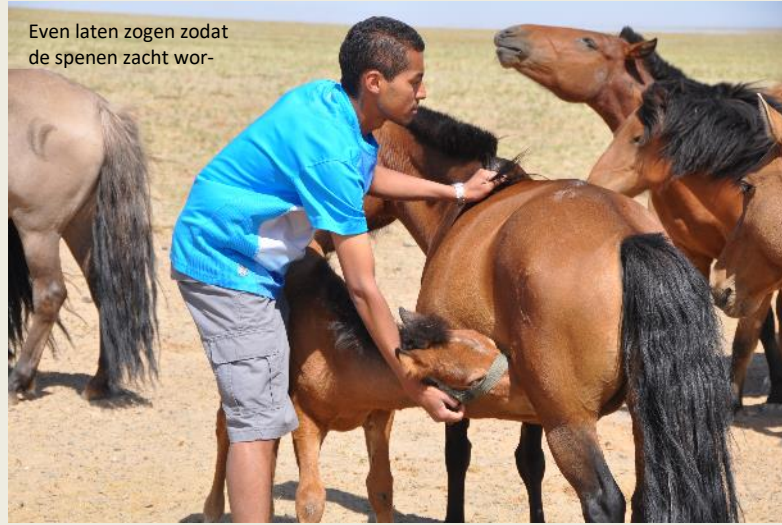
Even laten zogen zodat de spenen zacht wor-