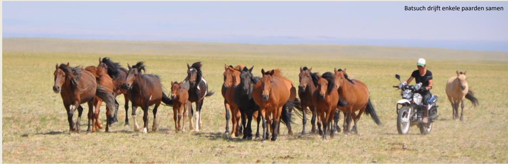
Batsuch drijft enkele paarden samen

Achteraan tegen de wand hangt een altaartje. Op een kastje staat een tv – naast de ger hebben we een schotelantenne en een zonnepaneel opgemerkt. Maar het zijn de medailles tegen de wand die onze aandacht trekken. Batsuchs paarden doen het blijkbaar goed bij de paardenrennen op de lokale en