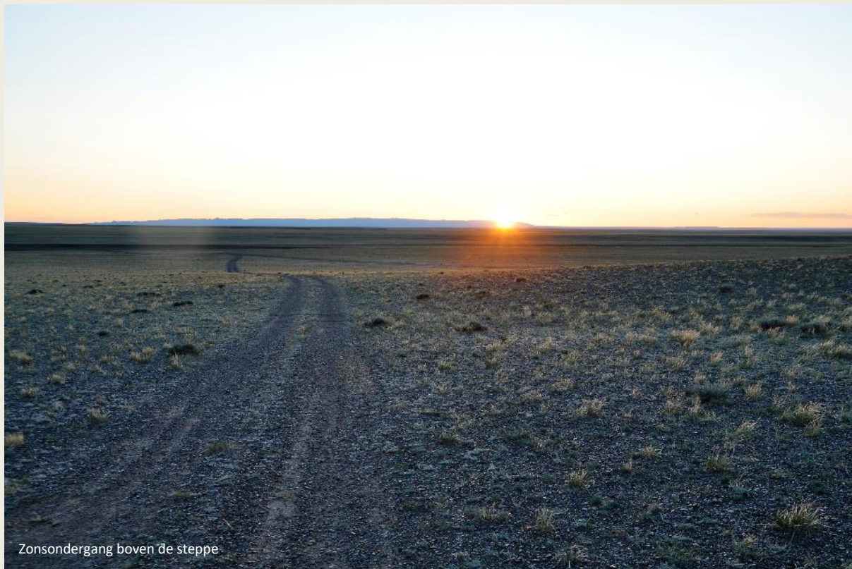
Zonsondergang boven de steppe

bulten onderscheiden ze zich duidelijk van de Arabische kamelen , dat zijn de dromedarissen met één bult uit de Sahara en het Midden-Oosten. Maar ze planten zich heel langzaam voort, waardoor de populatie er gestaag op achteruit gaat. Gemiddeld leeft een kamelenwijfje 25 jaar en is ze vruchtbaar vanaf haar vierde jaar. Een dracht duurt 13 maanden. Het kalf zal tot zijn tweede jaar zogen, maar zijn moeder blijft al die tijd vruchtbaar. Zodra ze opnieuw zwanger wordt, is het gedaan met zogen.