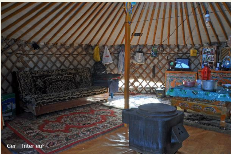
Ger – Interieur