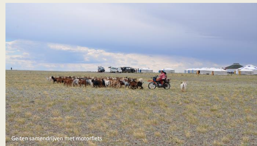
Geiten samendrijven met motorfiets