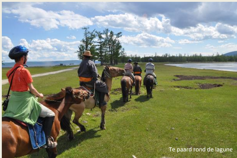
Te paard rond de lagune