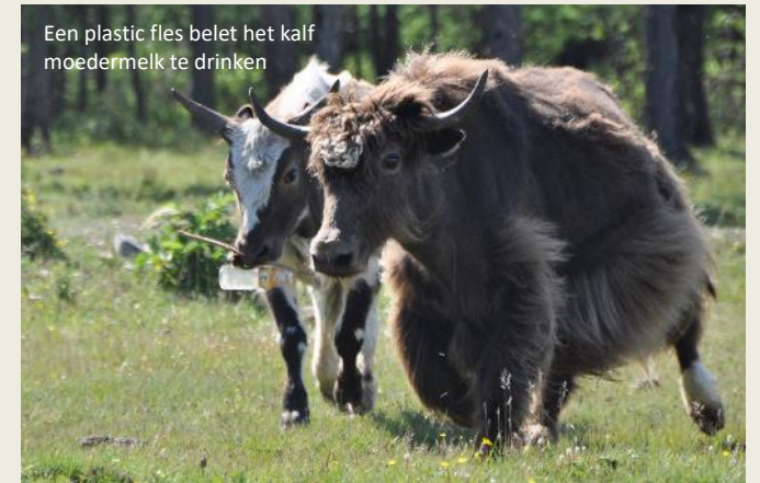
Een plastic fles belet het kalf moedermelk te drinken