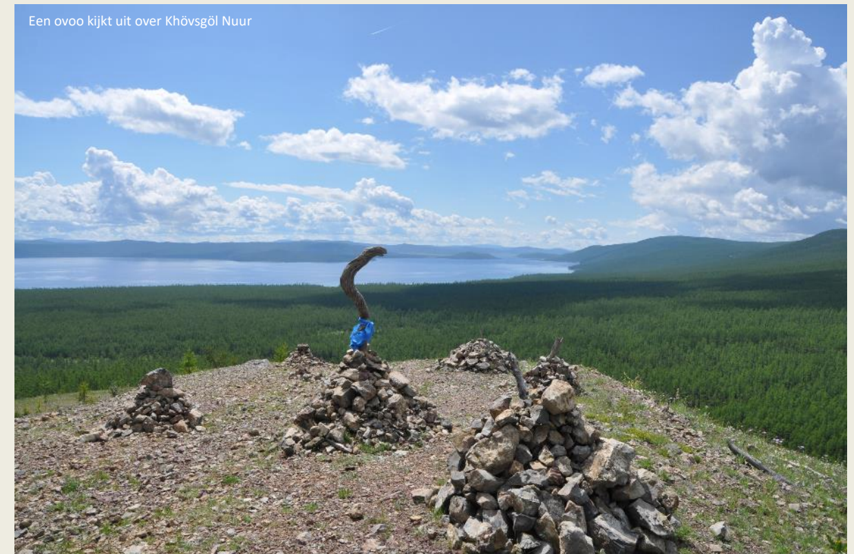
Een ovoo kijkt uit over Khövsgöl Nuur

Elke winter installeert zich een laag ijs van